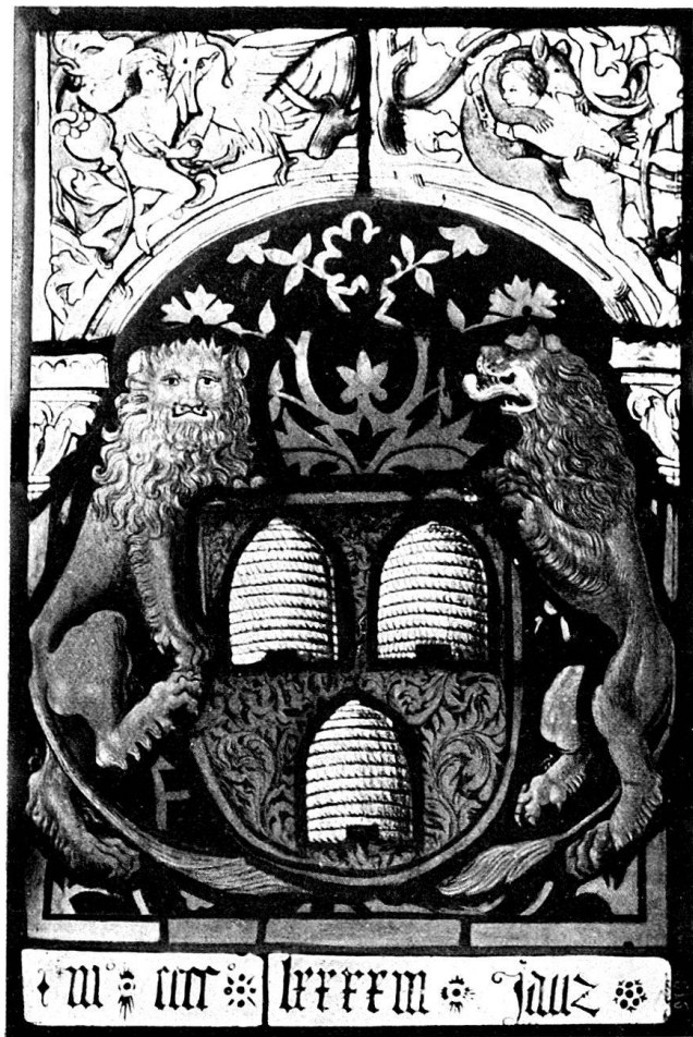
Abb. 4. Wappenscheibe von Büren. Historisches Museum in Bern.

Zu den ältesten Arbeiten unseres Meisters gehört eine Wappenscheibe der Familie von Büren im historischen Museum in Bern (Abb. 4). Sie stellt auf großmustrigem Damaste den Wappenschild in der älteren Form der zweiten Hälfte des 15. Jahrhunderts dar, gehalten von zwei Löwen, die in ihrer Zeichnung noch stark an die Arbeiten des Hans Noll erinnern. Diese Schildhalter sind für ein Privatwappen sehr auffallend und legen darum die Frage nahe, ob es nicht nachträglich an Stelle eines Bernerschildes eingesetzt worden sei. Auch der untere Teil der Scheibe scheint darauf hinzudeuten, daß sie ursprünglich als Umrahmung nur den in den 1480er Jahren gebräuchlichen Bandstreifen hatte. 1493 muß sie restauriert worden sein. Darauf weist die Jahrzahl mccccxxxiii in gotischen Minuskeln und das Wort „ jauz “, das offenbar heißen sollte „ jars “. Das Oberstück zeigt die damals beliebten Kampfszenen zwischen Kriegern oder zwischen Jägern und wilden Tieren, verchlungen in das Astwerk des abschließenden Bogens über den Nappen oder Figuren. Auch bei den beiden hier dargestellten