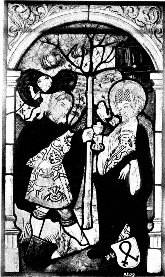
Abb. 5. St. Christoph und St. Barbara. Historisches Museum in Bern.

Nach einer Urkunde, die König Rudolf von Habsburg am 1. November 1283 im Lager von Peterlingen ausstellte, hatte der Vogt Ulrich von Thorberg den Ort befestigt und bat darum den König, denselben zu einer Stadt zu erheben. In der Tat wurde diesem Wunsche entsprochen. Kirchberg sollte der gleichen Rechte und Pflichten teilhaftig werden, wie die Stadt Bern, und einen eigenen Wochenmarkt bekommen. Doch wuchs in der Folge die junge Stadt nicht über die Kirche und ein paar Häuser hinaus. Nachdem der letzte Thorberger seine Burg in eine Karthause verwandelt und die Schirmherrschaft über dieselbe der Stadt Bern übertragen hatte, baten die Mönche nach seinem Tode ihre Schirmherrin