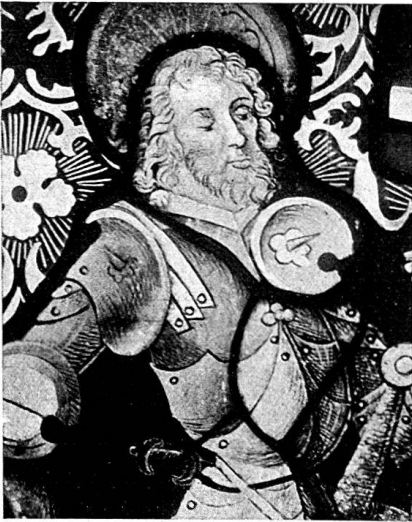
Abb. 2. St. Mauritius. Ausschnitt aus einer Figurescheibe in bernischem Privatbesitz.

Verwandt in der Zeichnung sind mit den Darstellungen auf dieser Vierpaßscheibe die auf einer runden Glarner Standesscheibe , welche aus dem Besitze von Prof. Dr. J. R. Rahn an das Schweizerische Landesmuseum kam (Taf. XIII b). Sie befinden sich auf sechs Kreissegmenten, welche mit nach innen gekehrtem Bogen einen Stern bilden, in den das Wappen des Standes Glarus mit dem hl. Fridolin eingesetzt ist. Ob dieser Wappenschild ein früheres Familienwappen ersetzt, wollen wir nicht entscheiden. Von den Figuren in den Segmenten stellen die beiden oberen zwei Engel in schwebenden Gewändern, die seitlichen zwei geharnischte Krieger aus dem Ende des 15. Jahrhunderts und die beiden untersten zwei mit Keulen bewaffnete wilde Männer dar; es sind demnach Embleme, welche sich recht wohl zur Einrahmung eines Standeswappens verwenden ließen. Der Hintergrund dieser weißen Figuren ist schwarz und mit ausgeritzten Sternen aus drei sich schneidenden Strichen besät.