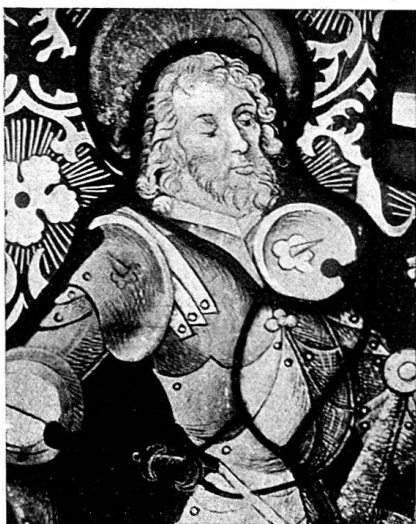
Abb. 2. St. Mauritius. Ausschnitt aus einer Figurescheibe in bernischem Privatbesitz.

Hintergrund dieser weißen Figuren ist schwarz und mit ausgeritzten Sternen aus drei sich schneidenden Strichen besät.