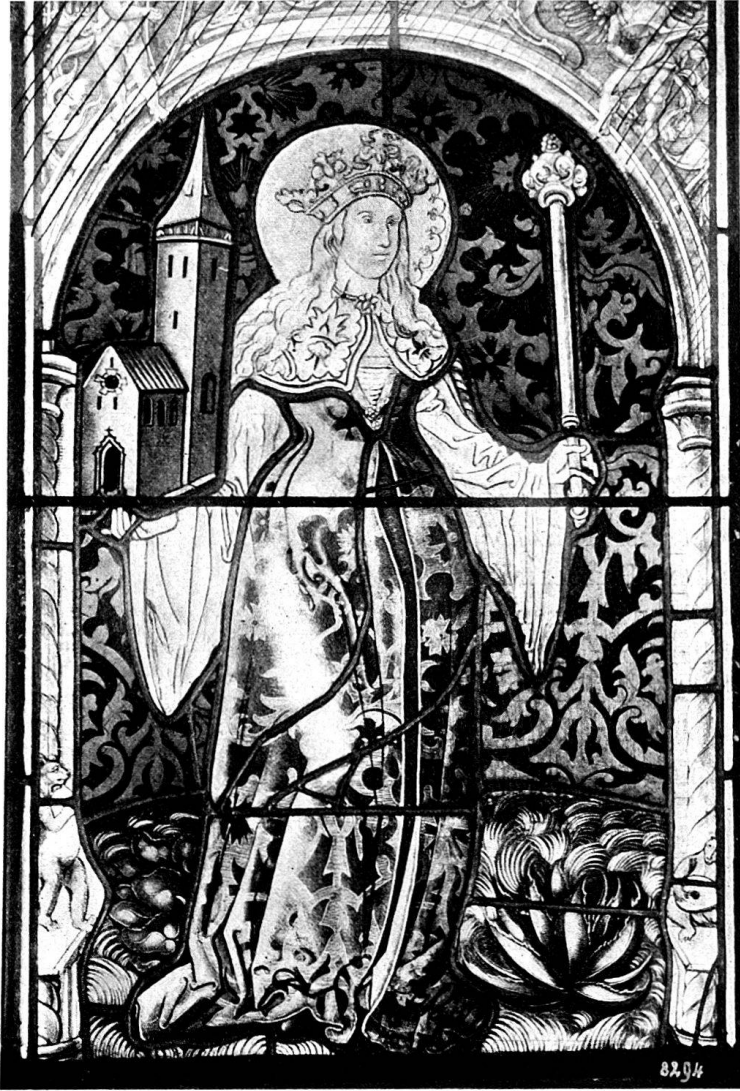
Abb. 6. St. Adelheid. Kirche von Kirchberg, Kt. Bern.