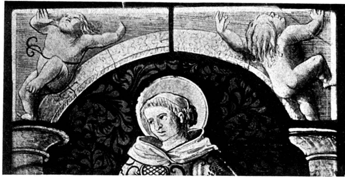
Abb. 3. St. Laurentius. Ausschnitt aus einer Figurescheibe in bernischem Privatbesitz.

uns als Bildumrahmungen in Zeichnungen des Hans Baldung Grien in der Sammlung Wyß erhalten blieben (Hist. Museum Bern, Bd. I, fol. 26 und 28). In diesem Glasgemälde, das schon dem Anfange des 16. Jahrhunderts angehört, verrät der alternde Meister, wie schwer es ihm fällt, die mit größerer Sicherheit begangenen Pfade der spätgotischen Kunst zu verlassen.