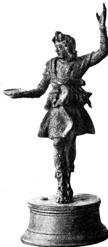
n o 14. Lare de Muri (p. 30).