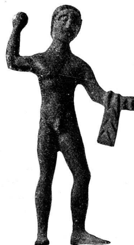
n o 32.