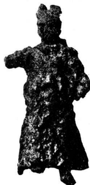
n o 55.