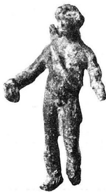
n o 21.