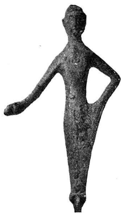
n o 58.

Deux protomés de béliers adossées; le trou percé au milieu indique que cet objet surmontait quelque tige 2) .