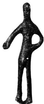
n o 45.

Personnage masculin nu, ithyphallique; bras collés contre le corps et jambes jointes. Informe.