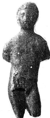
n o 22.