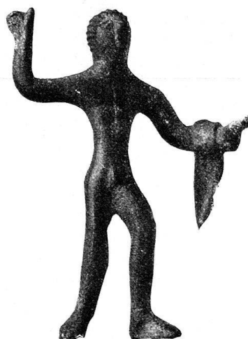
n o 27.