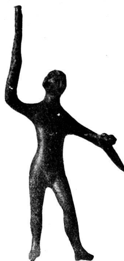
n o 28.

Pétase, chlamyde sur le bras gauche. Bras droit brisé.