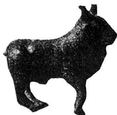
n o 64.