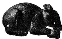
n o 70.