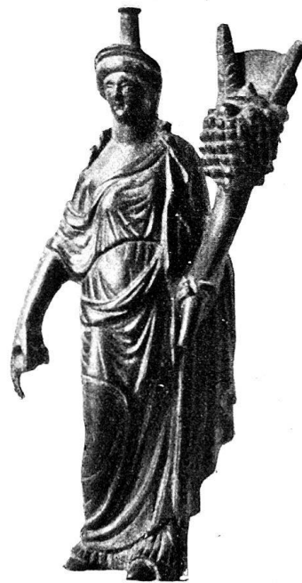
n o 52.

Buste (fragment de statuette) d'un personnage drapé, tenant la patère dans la main droite 2) .