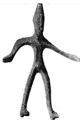
n o 24.

Héraclès barbu, couronné, la peau de lion sur le bras gauche, tient la massue dans la main