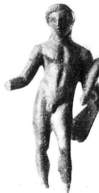
n o 23.