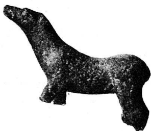
n o 67.