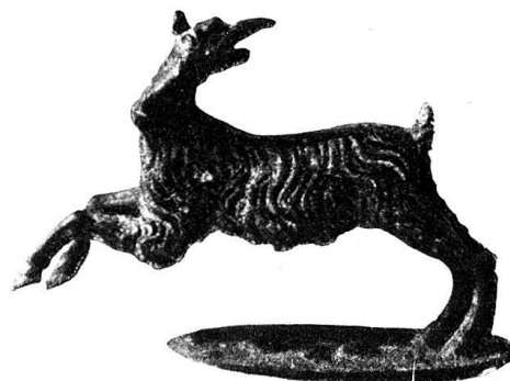
n o 62.