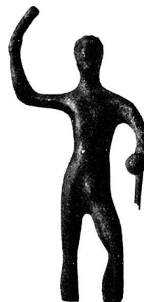
n o 29.