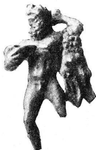
n o 25.