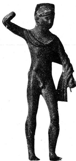
n o 26.