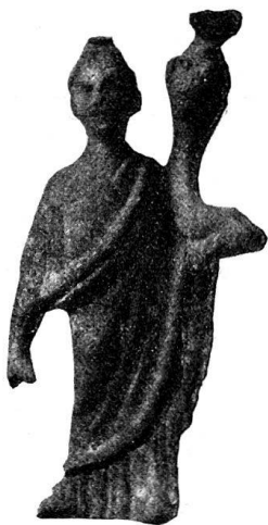
n o 53.