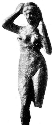
n o 54.