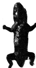
n o 69.