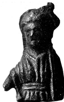
n o 56.