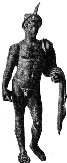
n o 20.

Héraclès imberbe. Le poids du corps repose sur la jambe droite. Sur la bras gauche, la peau de lion, et dans la main la massue. La main droite, brisée, tenait le canthare ou la pomme. Pieds brisés.