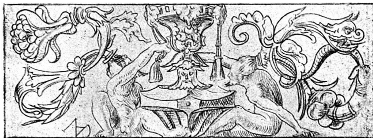
Abb. 4. Aus dem Schreibbüchlein von Niklaus Manuel. (P. Ganz, Taf. 9).