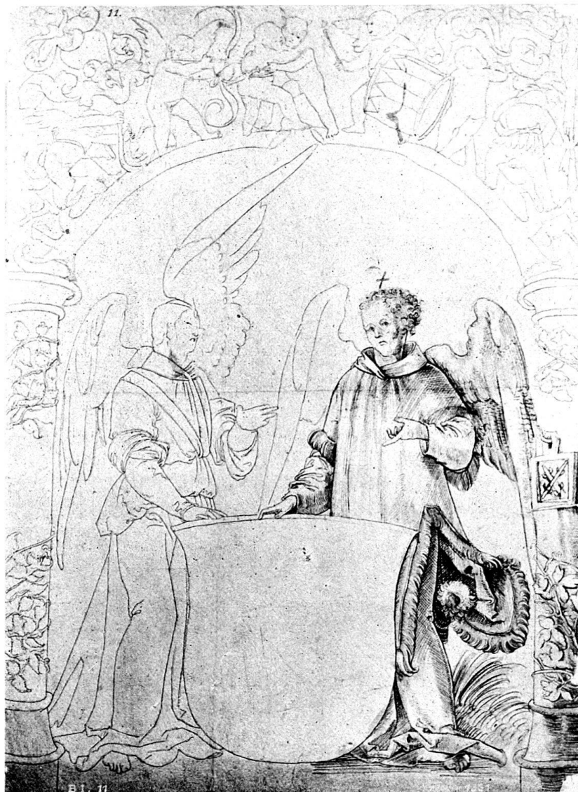
Abb. I. Berner Scheibenriß.

Dem Zyklus der Diesbach'schen Glasgemälde sehr nahe stehen drei weitere, von denen das eine links im mittleren Felderpaare des Schrägenfensters auf der südlichen Chorseite eingesetzt ist. Es stellt bei etwas geringer Höhe als jene, aber in gleicher Komposition, wie die Wappenscheiben, das sog. „ Wappen des Todes “ dar mit der Inschrift: „ Arma tue mortis nostre purgatio culpe / Avertant famulis noxia (sic) o (C)hriste. “ (Das Wappen Deines To-