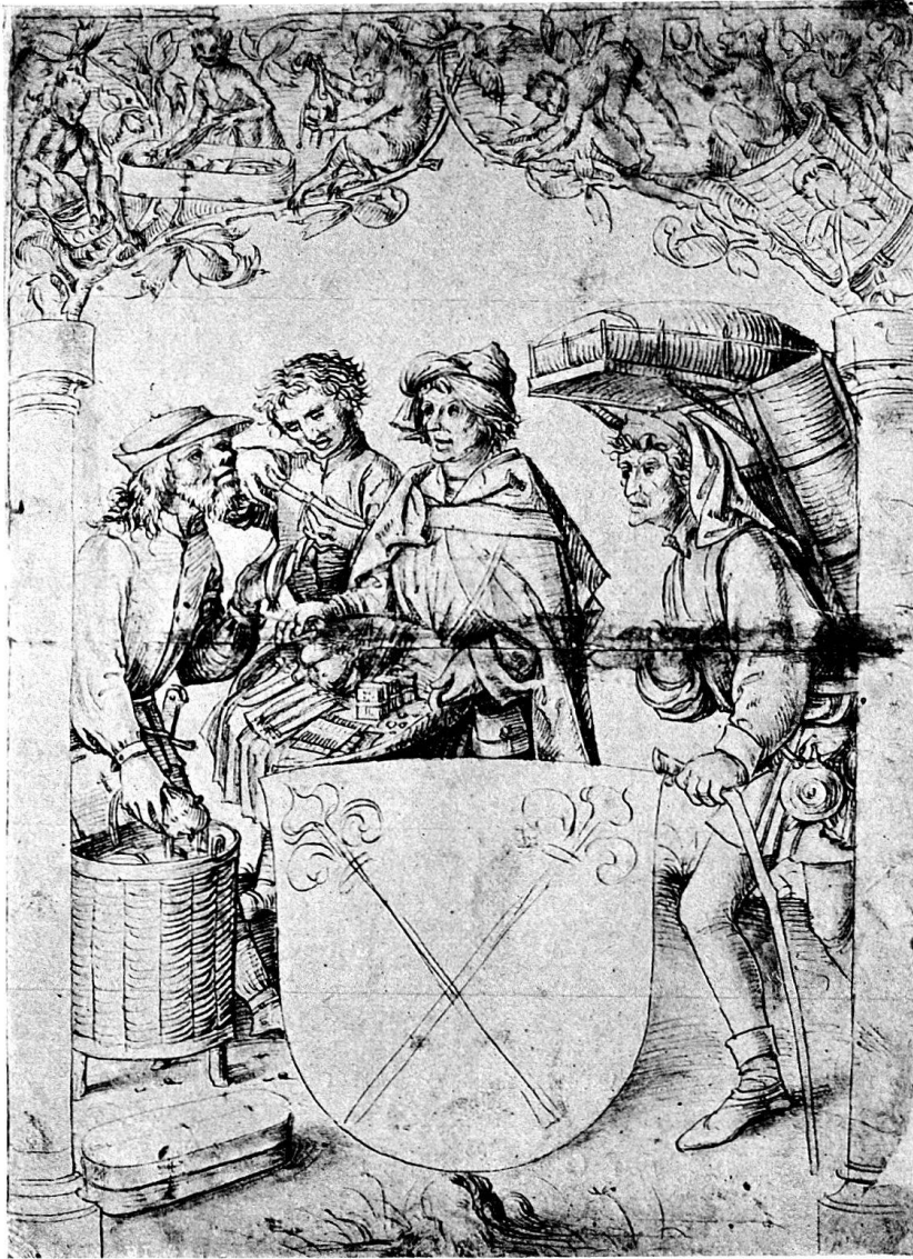
Abb. 2. Berner Scheibenriß.

eigenen Erfindungen, so vertraten sie doch eine gute Handwerkskunst. Was an erhalten gebliebenen Handzeichnungen außer dem schon (Bd. XV, S. 220) abgebildeten Pannerträger ihm zugewiesen werden darf, bleibt noch näheren Untersuchungen vorbehalten, ebenso wie die Frage, ob nicht vielleicht in seiner Werkstatt der junge Niklaus Manuel die ersten Anregungen für seine künst-