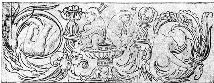
Abb. 3. Aus dem Schreibbüchlein von Niklaus Manuel. (P. Ganz, Taf. 9).

den Werken jüngerer Meister, die sich rascher in die Kunst der Renaissance hineingelebt hatten, nachgebildet und mit Hülfe tüchtiger Gesellenhand ausgeführt worden sein mag, so beweist doch die Reinheit des Stiles, die seine