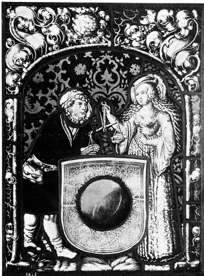
Abb. 4. Wappenscheibe mit unbekanntem Wappen. Schweiz. Landesmuseum.

burg, einen alten, reichen Mann in Lederstiefeln vor, der einen pelzverbrämten roten Rock und eine große Geldtasche am Gürtel trägt. Er stützt sich auf den Schild. Diesem gegenüber steht eine vornehm gekleidete Dame,