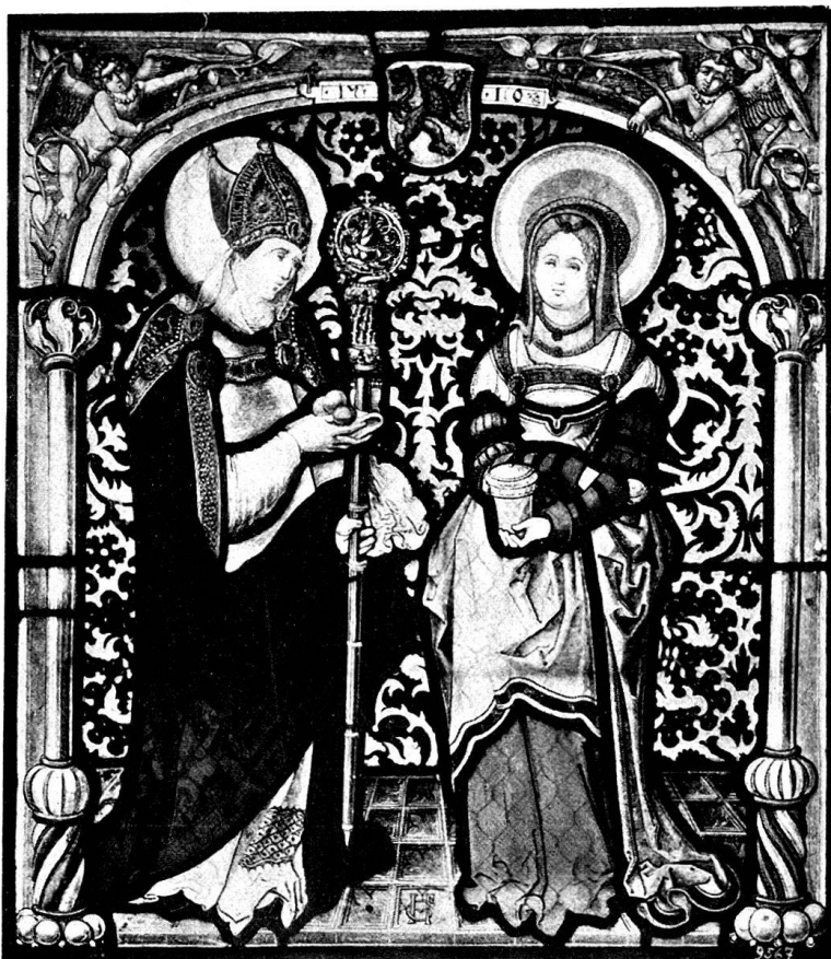
Abb. 1. Figurenscheibe mit Wappen der Stadt Bremgarten. Hist. Museum in Bern.

Das zweite Glasgemälde aus dem Jahre 1510 schmückt heute noch ein Fenster in der Kirche des großen bernischen Dorfes Melchnau , das hart an der Grenze gegen den Kanton Luzern liegt. Es stellt den Papst Urban dar, welcher, geschmückt mit der Tiara, in der Rechten einen Stab mit einem kostbaren dreifachen Kreuz, in der Linken eine Traube hält. Die Figur ist demnach eine Kombination des Papstes Urban (222 bis 230), der sonst mit einem Schwerte dargestellt wird, mit dem Bischof Urban von Langres, der sich nach der Legende vor seinen Verfolgern hinter einem Weinstock verbarg, nachher Patron der Weingärtner in Frankreich wurde und infolge dessen gewöhnlich mit einer Traube in der Hand abgebildet wird. Der Heilige trägt über der Dalmatika ein faltenreiches Pluviale mit reich gestickter Kappa, die bis über die Schul-