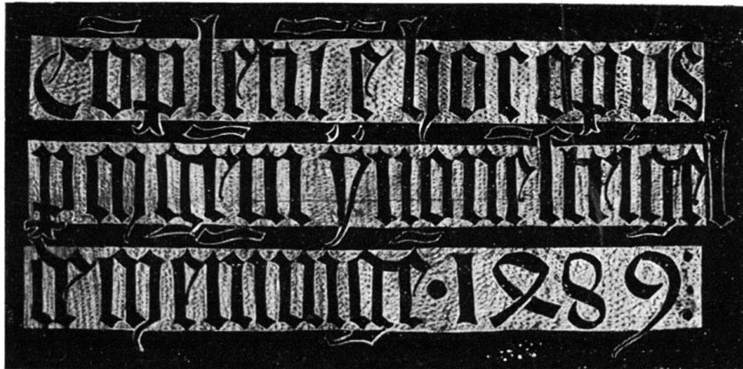
Abb. 5. Gothische Inschrift 5) .

mit einer Darstellung des Schweißtuches, unten, die andere an ganz ungewohnter Stelle, oben, wo sich sonst der Aufsatz befindet, zeigt sieben geschnitzte Halbfiguren (Abb. 3). Die Maße 1) dieser Predella passen nicht zum Altar, während die untere gemalte diesem entspricht. Da dieses Werk auch aus Grono stammt, liegt die Vermutung nahe, daß die zweite Staffel einen Bestandteil jenes dokumentarisch belegten Altares in St. Clemente ausmacht. Der Stil widerspricht dem nicht. Sie zeigt sieben Halbfiguren, etwa Heilige darstellend, in jugendlichem Alter, deren gestikulierende Handbewegungen auf eine Disputation schließen lassen. Eine sichere Deutung der Szene zu finden ist schwer. Ob hier wirklich die Stifter des Altars, darunter zwei Pröbste von S. Vittorio, dargestellt, wie der Verfasser des Artikels im Bündner Tagblatt (163) glaubt, ist zu be-