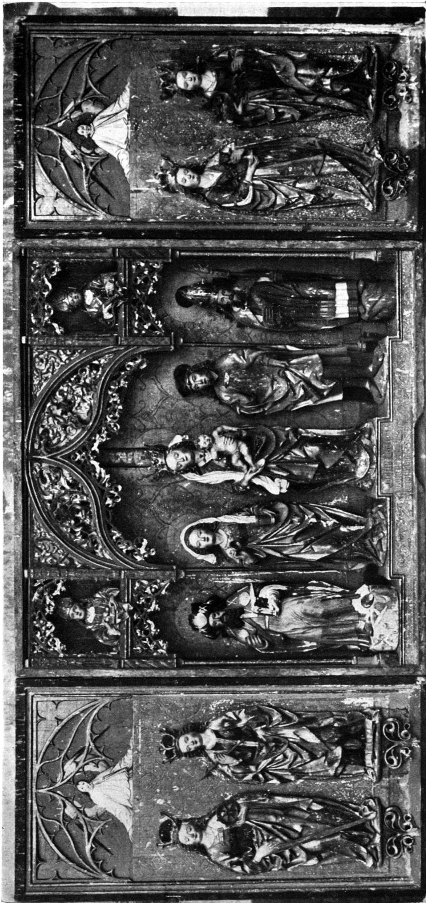
ALTAR VON IVO STRIGEL, ST. AGATHENKAPELLE BEI DISENTIS.