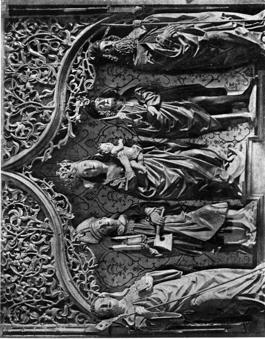
ALTARFRAGMENT IN BRIGELS.