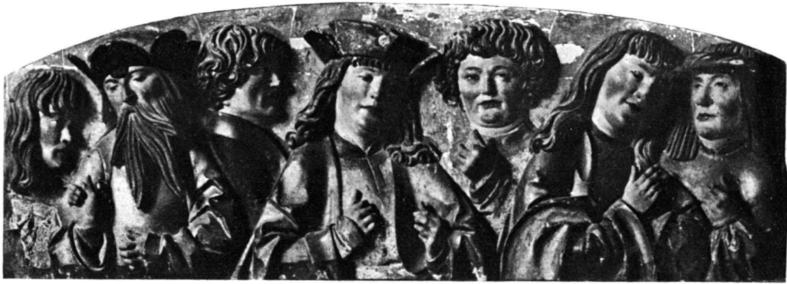
Abb. 3.

Kunst Strigels liegt es nicht, tiefsten Seelenausdruck wiederzugeben, sondern mehr durch äußere formale Vorzüge und häufig durch Anmut zu erfreuen.