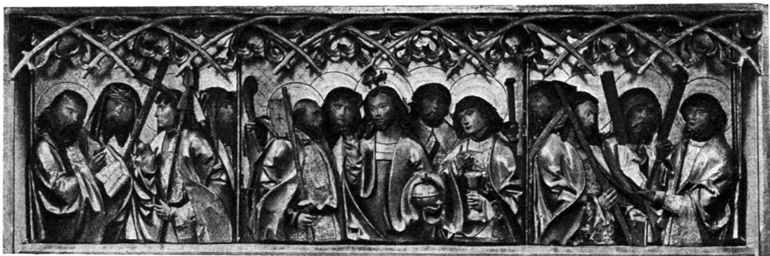
Abb. 4.