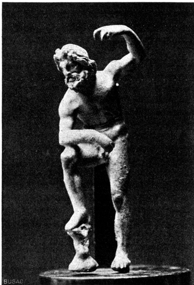
Fig. 1. Neptune, trouvé à Vevey.