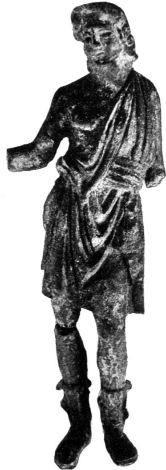
Fig. 2. „Camillus“, trouvé à Poliez-Pittet (Vaud).

Il est permis de supposer que le propriétaire de ce précieux dépôt l'avait caché à l'approche d'une invasion, peut-être celle des Allémans, vers 265, et qu'il n'a pas pu rentrer en possession de son bien. C'est de cette époque également qu'on peut dater plusieurs des dépôts de monnaies découvertes dans nos régions. Et cela rappelle étrangement les trésors qui furent enfouis dans le sol lors de la grande peur qui précéda les invasions dans le cours des guerres de Bourgogne, et qu'on retrouve aujourd'hui à plus d'un endroit dans le Pays de Vaud.