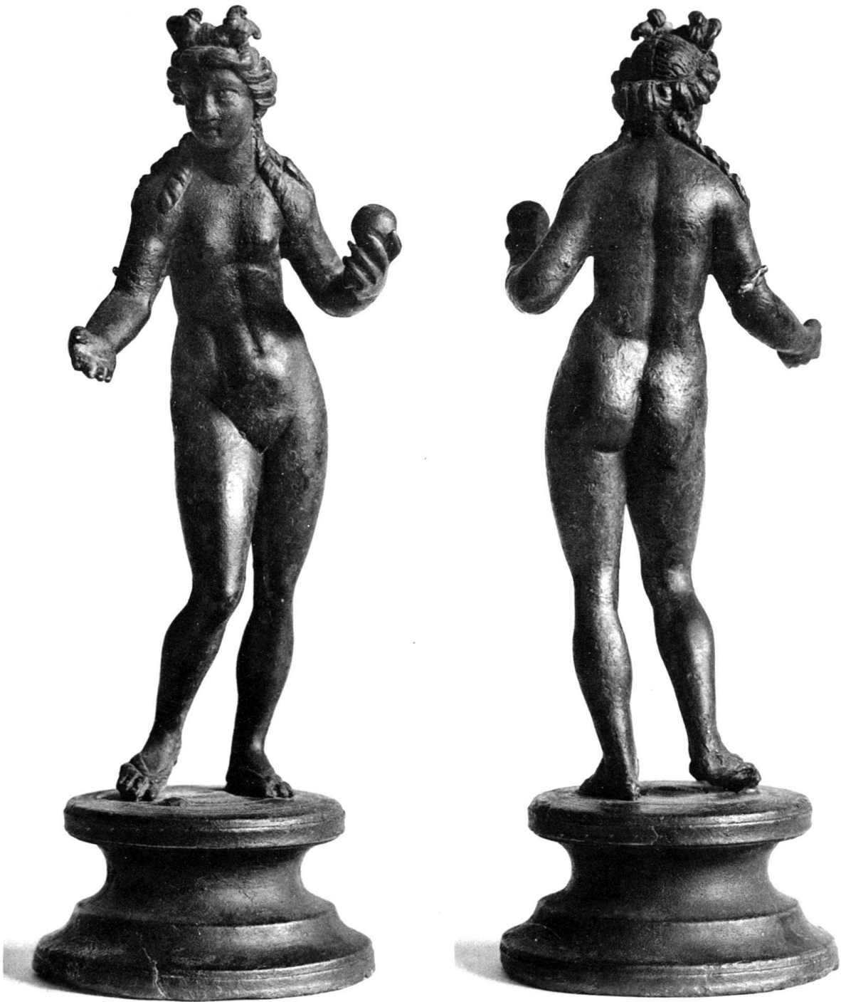
STATUETTE DE VÉNUS TROUVÉE À POLIEZ-PITTET (VAUD)