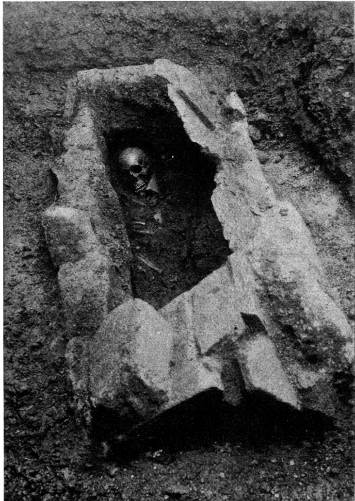
Abb. 8. Oberburger Plattengrab 1918.

groß sind, und von den Dachziegeln, die spätrömische Form zeigen. Unter den abgefallenen Grabteilen lag das Falzziegelbruchstück mit den Buchstaben I R, von dem noch besonders zu sprechen ist. Das Grab ist, getreu wieder aufgebaut, im Museum aufgestellt; mit dem Skelett, dessen Bestandteile der Konservator sorgfältig zusammengefügt hat. In einem Kistchen neben dem Grabe liegen die Steine und die Erde aus der Schädelhöhle. Bemerkenswert ist, daß einige der Zähne Schäden aufweisen, die höchst wahrscheinlich, auch nach Ansicht Sachverständiger, von der Zahnkrankheit Karies der lebenden Person herrühren.