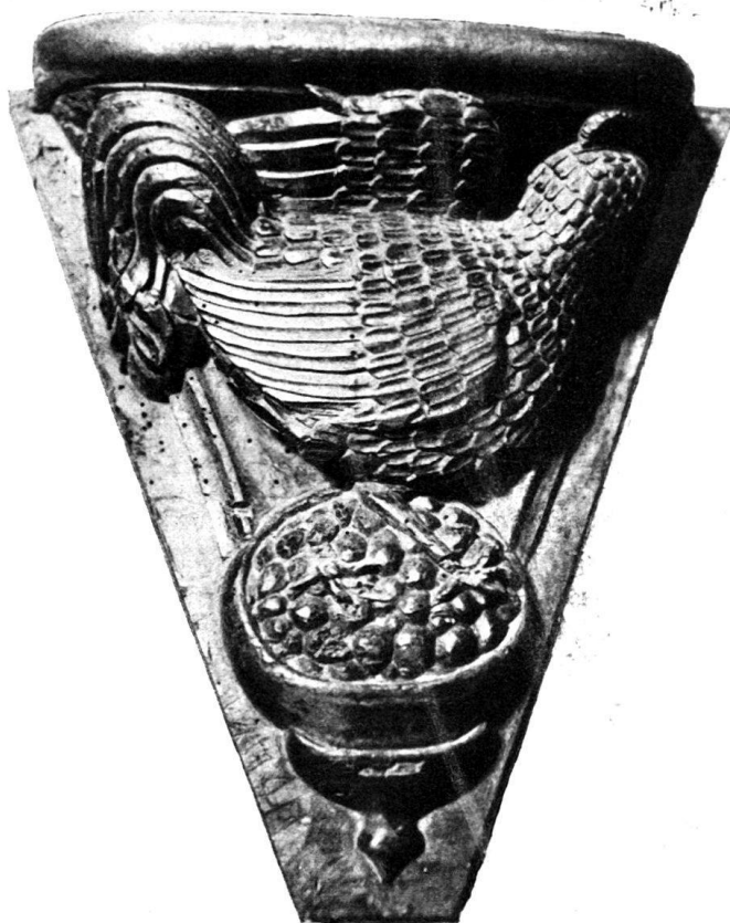
Abb 2. Miserikordie des Chorgestühls.

Resultaten, daß die Charakterisierung immer ausführlicher und besser wird, führt auch die Betrachtung der Hirsche 1) (Fries außen am Chor und Zwickelfüllung der Chorstühle) (Nr. 71) 2) , der Bären (Fries an einem Kryptapfeiler) 3) , Kapitell im Chorungang 4) , an welchen nicht alle Tiere zoologisch bestimmbar sind (Nr. 45, 48), Knauf am Chorgestühl (Nr. 142) 5) , der Stiere (Emblem des Lukas an der Galluspforte 6) , Relief an einer Chorstuhlwanne, Nr. 126) 7) , der Hunde (Jagden an den Friesen der Kryptapfeiler 8) und am Fries über den Blendarkaden 9) ; Knauf eines Chorstuhls 10) sowie der Vögel. Während die romanischen Künstler an den Vogelkapitellen der Galluspforte, am Adler des Johannes 11) ebenda, an Friesen in der Krypta 12) , am Chorungang 13) und auf der Vinzenztafel 14) den Körper und z. T. auch Flügel und Schwanz gleichmäßig mit rundlichen, schuppenartigen Federn bedecken und nur die äußersten Federn von Flügeln und Schwanz länger gestalten, während sie also hier ziemlich schematisch verfahren, gelingen ihnen doch der Flug und gewisse Wendungen vorzüglich (Vinzenztafel, Fries in der Krypta) 15) .