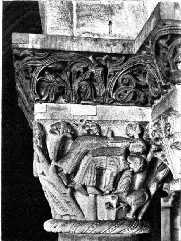
Abb. 1. Pyramus und Thisbet. Kapitell im Chorumgang.

rallele Wandlung von philosophischen Anschauungen und künstlerischer Auffassung erörtert. Er sucht die allgemeinen geistigen Grundlagen der mittelalterlichen Kultur aus den Schriften der großen Denker zu eruieren, d. h. das jeweilige Verhältnis des Menschen zu den transzendental religiösen Ideen und den realen Tatsachen und der Natur festzulegen. Der keineswegs leicht zu verfolgende Gedankengang Dvořáks würde, auf einzelne typische Beispiele des Basler Münsters angewendet, folgendermaßen lauten: Die Vinzenztafel mit ihrer Verwendung spätantiker illusionistisch-malerischer 1) Vorbilder stellt also eine späte Nachahmung jener Auflösung der Form in farbige Werte, in Licht und Schatten dar, „die äußerste Grenze, zu der die klassische Kunst in dem Streben nach der Objektivierung der Naturphänomene gelangte“. Aber dieser „auf sensueller Überzeugungskraft allein beruhende illusionistische Stil“ wurde vom „abstrakten“, übersinnlichen des hohen Mittelalters (Galluspforte, Erlösungszyklus im Chorumgang, Frieze der Krypta, Architektentafel, Glücksrad u. s. f.) abgelöst. Wie erklären sich gegenüber dem Stil der Vinzenztafel die starre, säulenhafte Haltung der Evangelisten, die geometrische Anlage der Gewänder, die schematische Be-