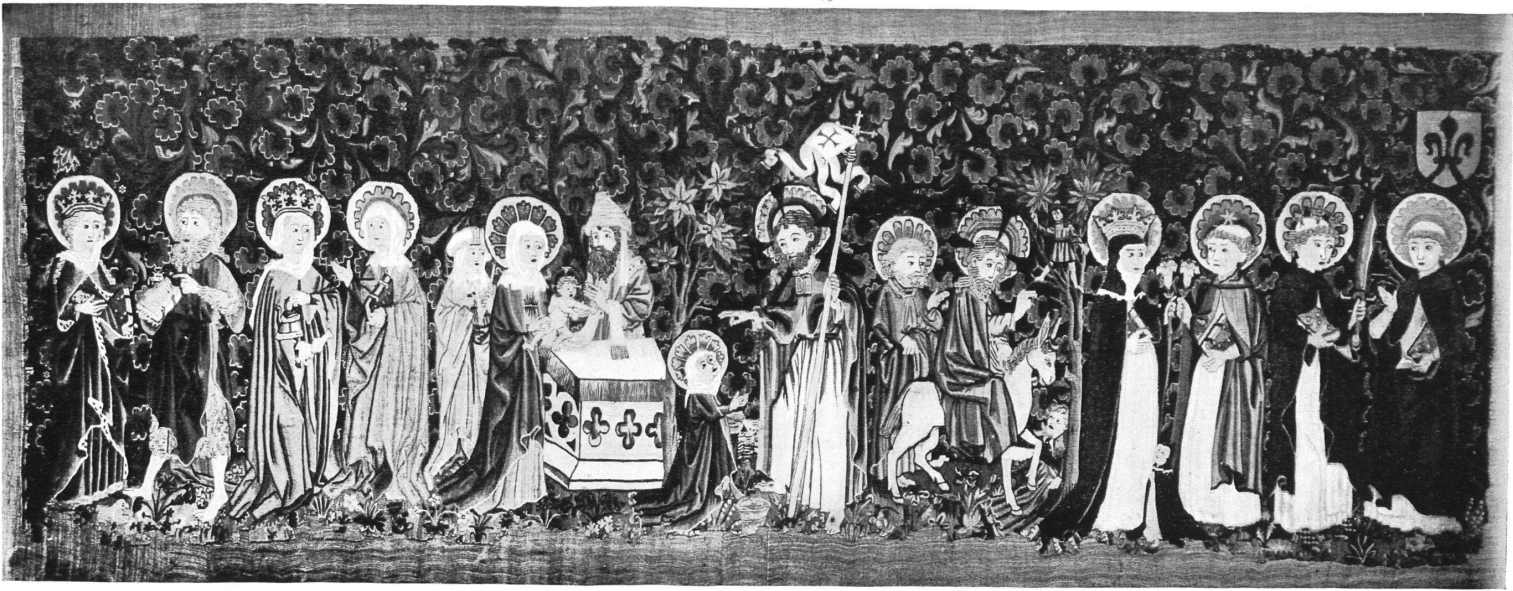
Schönkind-Teppich. Höhe 1,05 m, Breite 3 m. Basel, 15. Jahrh. Im Historischen Museum zu Basel. Ankauf 1920.