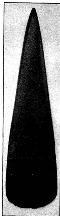
Abb. 15. Zierbeil aus Serpentin mit Schnurloch, von Cham. Ca. 1:4. Sammlung der Kantonsschule.