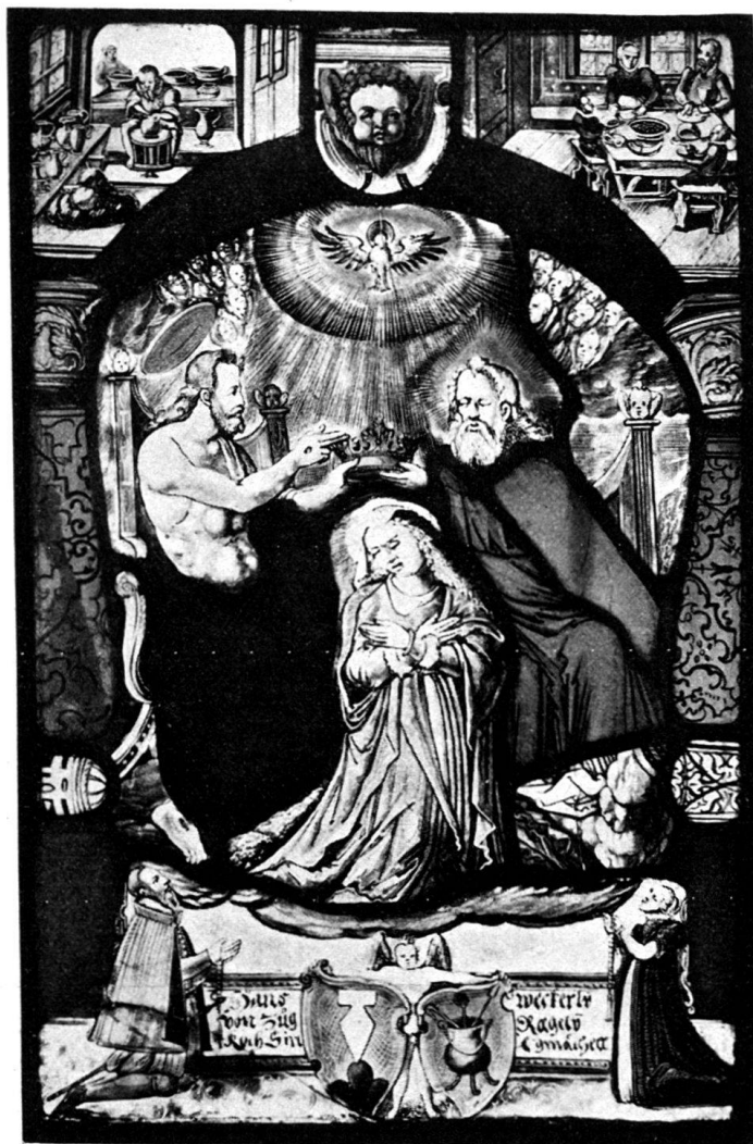
Abb. 1. Glasgemälde mit Wappen Weckerli-Koch, 16. Jh., IV. Viertel. Basel, Hist. Mus.