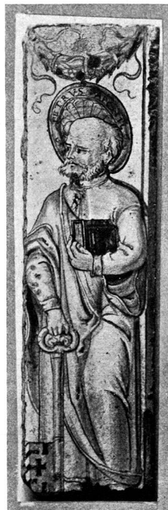
Abb. 2. Lisene, angeblich zu dem Ofen aus Beromünster gehörend.

das erstere bejahen. Darauf weist die Wappenfigur, der in Form einer Pflugschar gezeichnete Hafnerspaten. Noch mehr aber wird dies bestätigt durch ein im Historischen Museum in Basel aufbewahrtes Glasgemälde (Abb. 1). Diese Scheibe zeigt eine auf den Namen unseres Meisters lautende Stifterinschrift. Eine Berufsangabe fehlt, wird jedoch ersetzt durch das eine der beiden