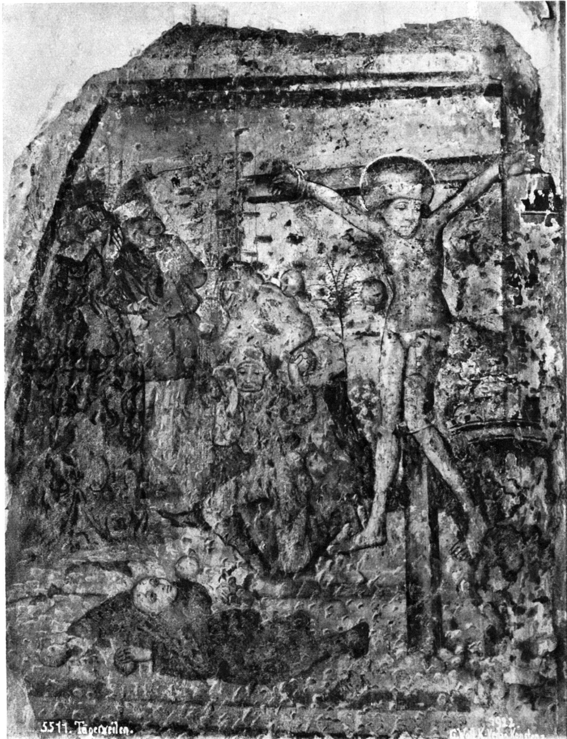
Darstellung aus dem Martyrium der Heiligen Cosmas und Damian.