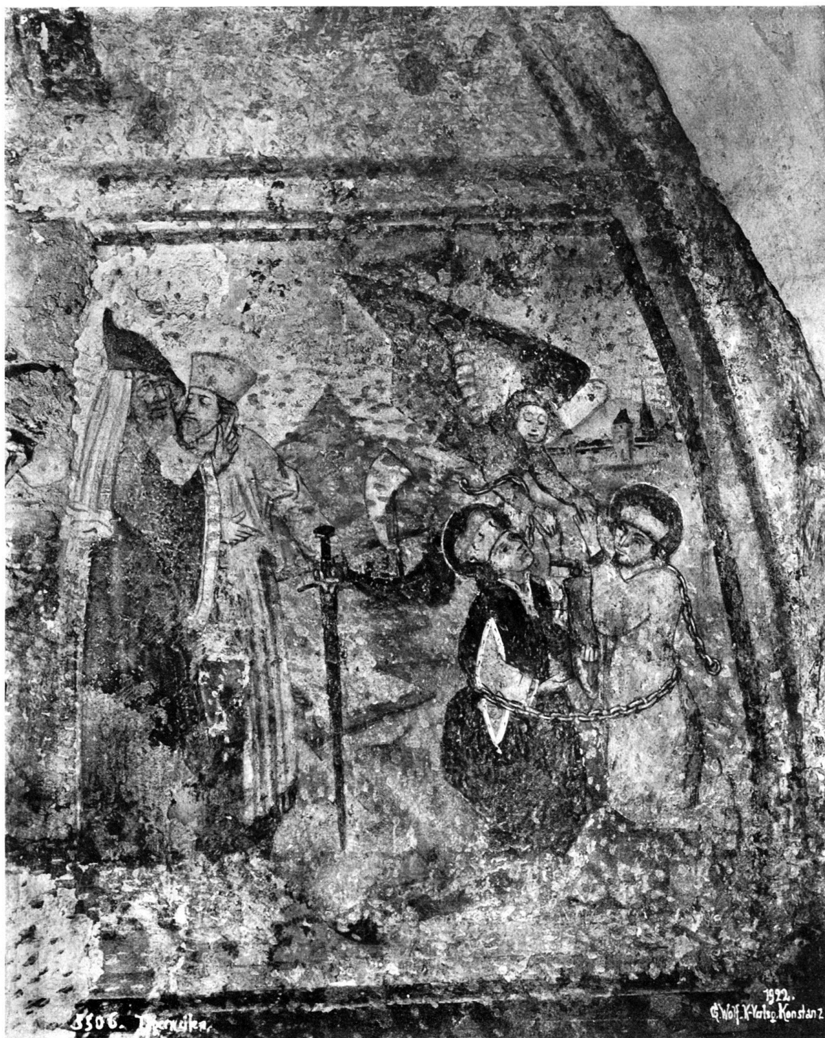
Darstellung aus dem Martyrium der Heiligen Cosmas und Damian.