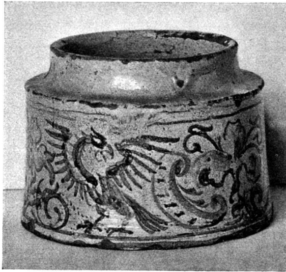
Abb. 5. Dose aus Zug. (Zürich, Landesmuseum.)

Die zu der zweiten Gruppe gehörenden Stücke, die wir ebenfalls noch mit Unterstützung des Herrn Scheuchzer verifizieren konnten, sind leider sehr zerstört. Nur zwei derselben erhielten nach dem Zusammenstücken der Fragmente ihre ursprüngliche Form. Die vier übrigen sind nur zur Hälfte oder zu zwei Dritteln vorhanden. Die Grundform aller ist die gleiche wie bei der im Landesmuseum aufbewahrten Lisenen mit dem vertieften Mittelfeld (siehe Abb. 1) 1) . Das Ornament dagegen ist verschieden.