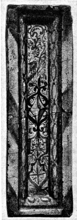
Abb. 1. Lisene. Schweiz. Landesmuseum (S. 103, No. 20).

Grün und Manganviolett. Gelb ist spärlich verwendet und wie Grün nur als Lokaltön, der zufolge der bläulich oder violett durchschimmernden Zeichnung gerne eine grünliche oder olivfarbene Tönung annimmt. Im allgemeinen kann gesagt werden, daß die Zeichnung des Rollwerkes wie auch der Schriftbänder und Wolken samt den die Darstellungen umschließenden Rahmen und den Seitenflächen der Kachelplatten blau gehalten ist. Manganviolett kommt vor in den Fleischteilen, Architekturen und Schriften, Grün und Gelb wie oben erwähnt als Lokaltöne, mit denen einzelne Teile der Zeichnung übergangen sind, z. B. der Boden, das Blattwerk, die Flügel Amors, des Teufels und Engels auf einer der großen Lisenen, der Mantel und Lendenschurz von «Soll» und «Mercurius» bzw. Haare, Szepter und Kronen der Figuren, der Becher der kredenzenden nackten Frau, der Leib der Schlange, einzelne Architekturglieder der blau gezeichneten Pfeilerstellungen auf den kleinern Tafelchen, die Heiligenscheine und Früchte, die Panzerverzierungen und Schulterspangen, sowie das Schuhwerk der Figuren auf den kleinern Lisenen 1) .