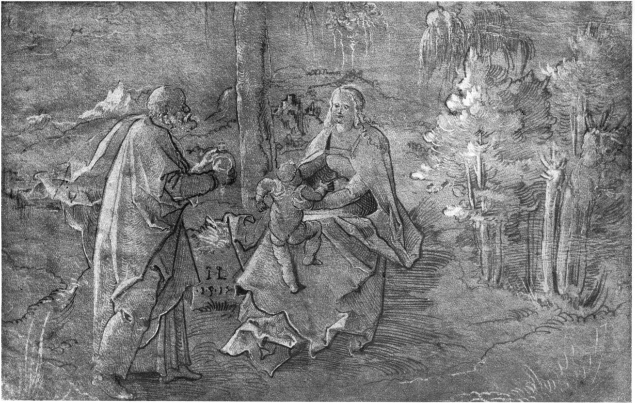
HL. FAMILIE. ROTTERDAM.