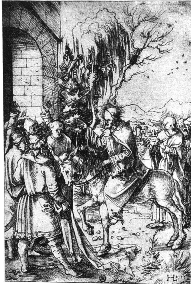
Abb. 19. Einzug Christi. Berlin.

Haben die letzten vier Zeichnungen eine ziemlich dicht geschlossene Gruppe gebildet, so steht der Einzug Christi in Jerusalem in Berlin (Maße 18,5 × 12,2 cm, Feder) (Abb. 19) etwas abseits 1) . Er muß gegen Ende des Jahres 1517 entstanden sein, denn eine deutlich bemerkbare Veränderung liegt zwischen diesem Palmsonntagsbild und den frühern Blättern. In den breiten, rundschildigen Kopftypen, dem festern Strich und der weitergetriebenen Auflösung des Konturs