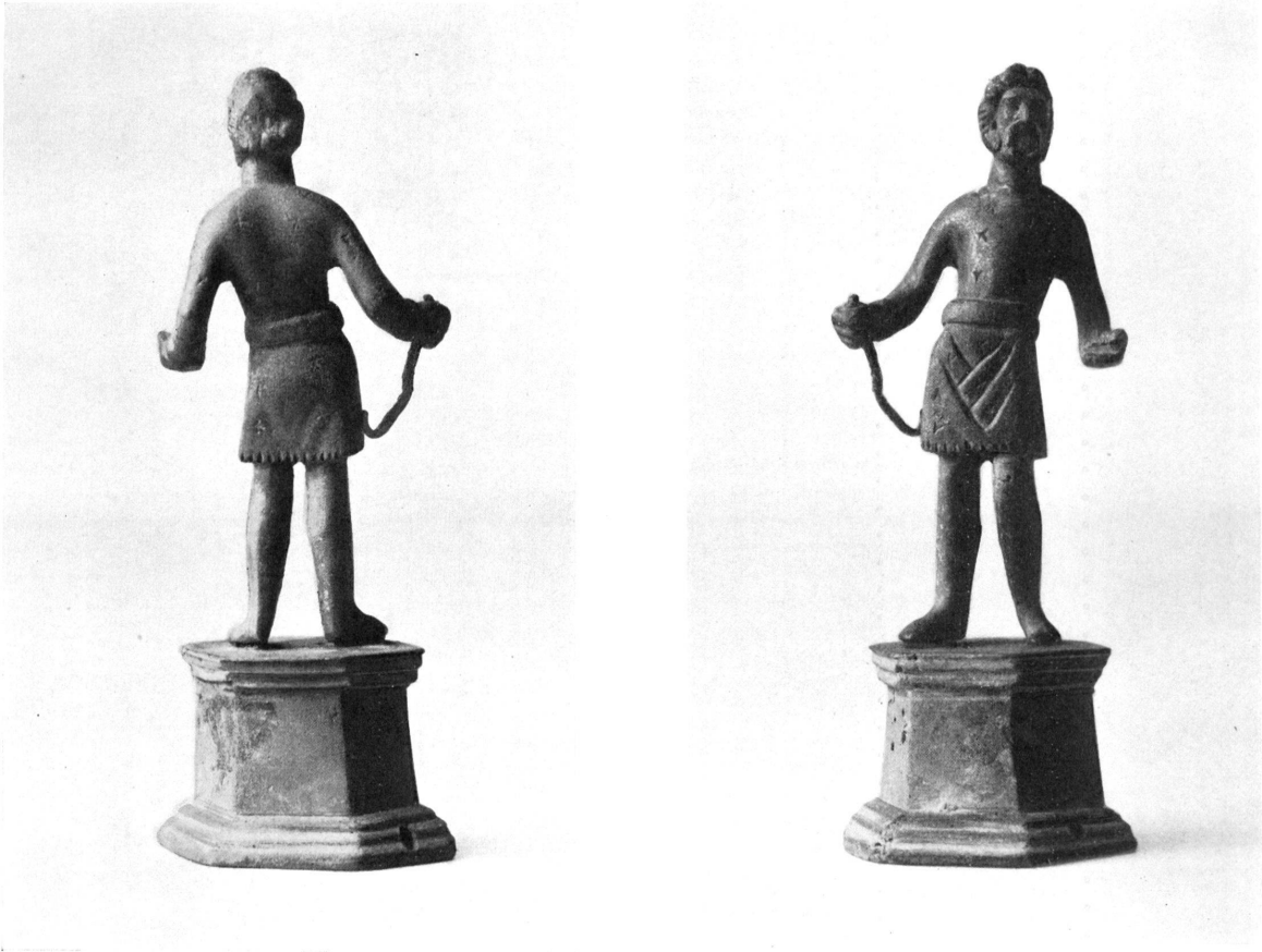
SUCELLUS AUS AUGST. (Zu S. 203.)