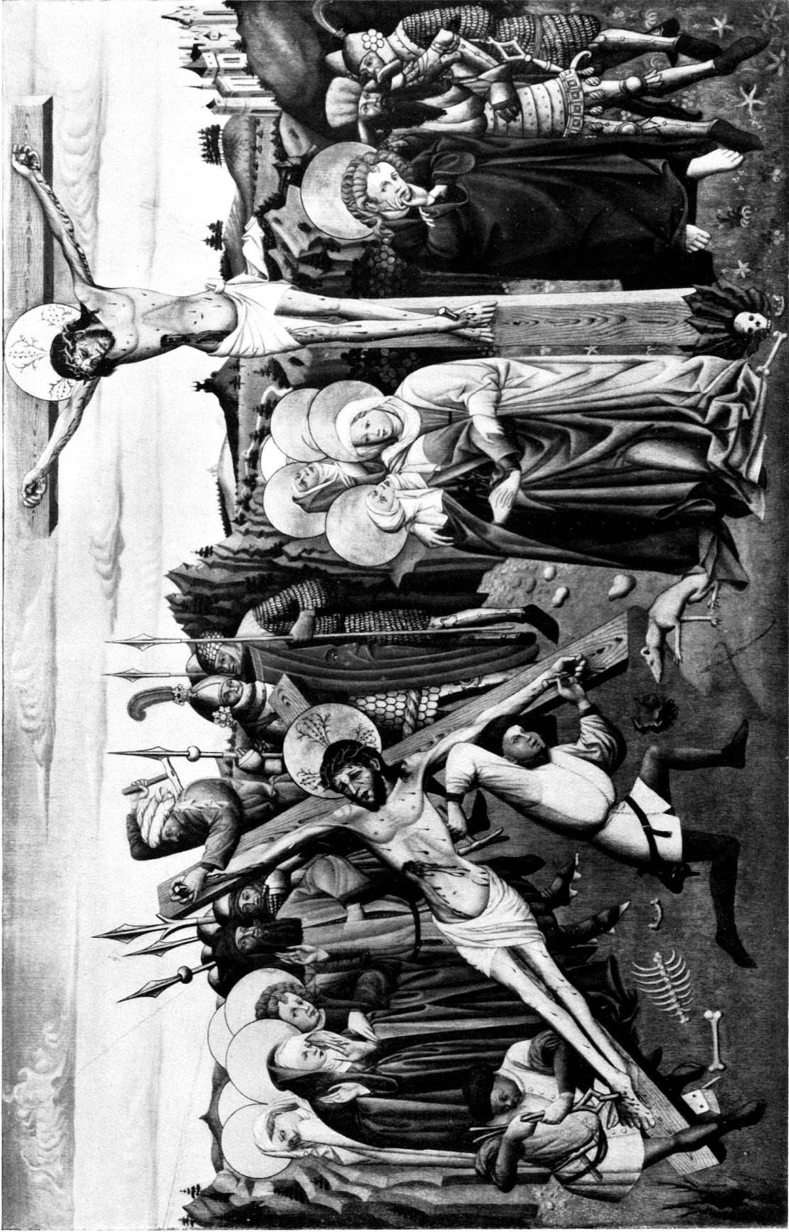
Albrecht Mentz: KREUZIGUNG. (Museum Solothurn.)