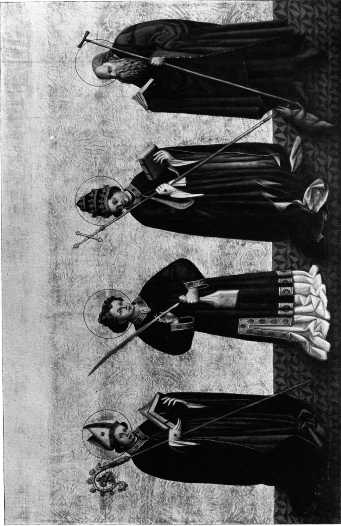
Albrecht Mentz: VIER HEILIGE AUF GOLDGRUND. (Museum Solothurn.)