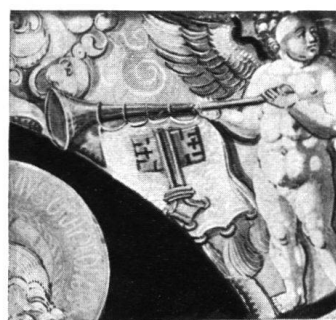
17b. 16. Jh. Anf.