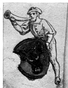
4. 16. Jh. I. Viertel