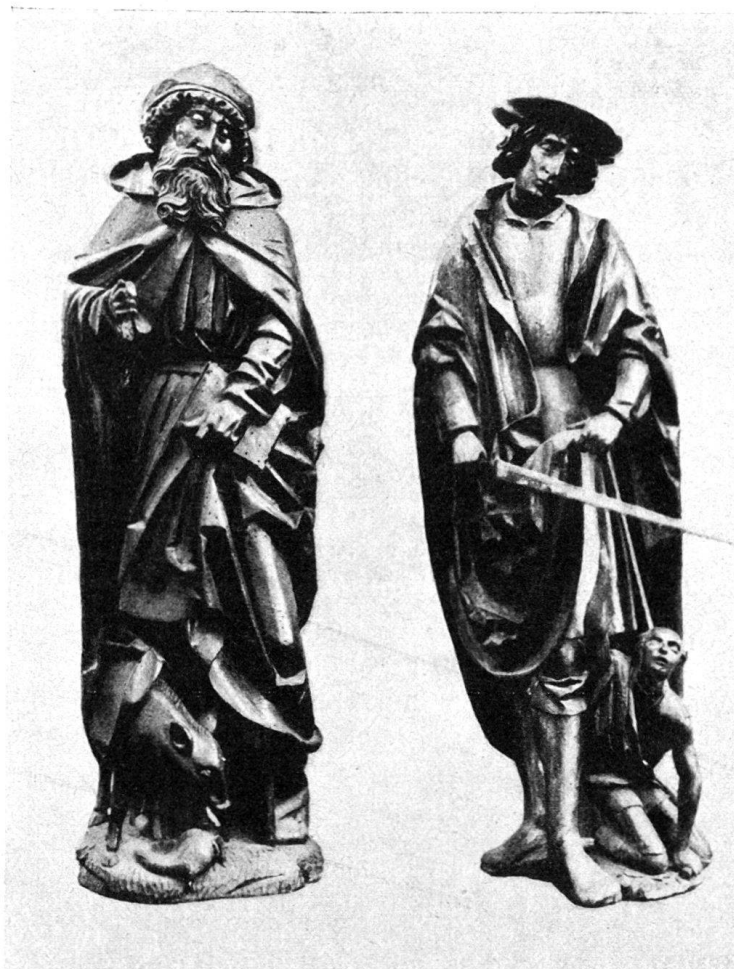
Abb. 1. Die Heiligen Antonius und Martin in Cugy.

Anschauung: er war 1513 beim Zug nach Dijon dabei. Geiler hat einen individuellen Gesichtstypus: die Köpfe sind klein, mit kurzem, dünnem Mund, schmalschlitzigen Augen, scharfem Nasenrücken und spitzem Kinn. Die dünngrätigen Falten fließen geschmeidig. Sie werfen wenig Licht, so daß eine reizvoll flimmernde Gesamtwirkung entsteht. Er liebt es, eigentümlich stilisierte Landschaften anzudeuten. Fast genau dieselbe Komposition der Kreuzabnahme hat Geiler auf einem der vier Reliefs aus Cugy wiederholt.