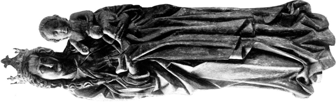
b) MADONNA, Holz, aus Hinterhöfen. Landesmuseum.