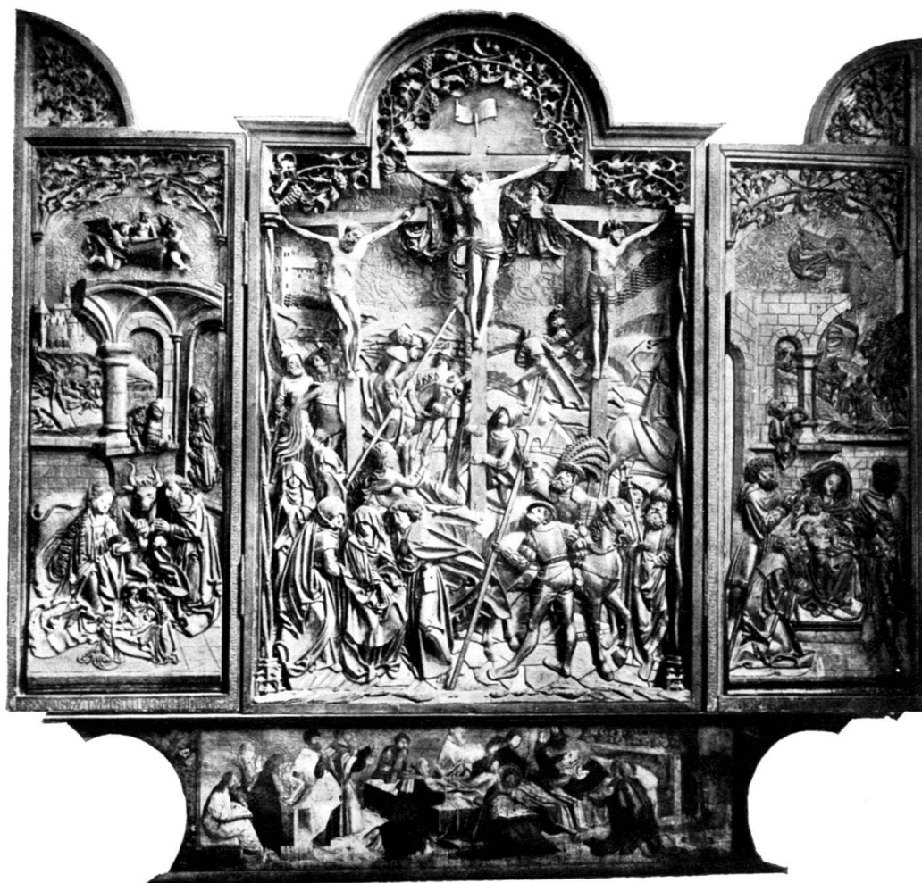
FURNO-ALTAR. Franziskanerkirche in Freiburg i. Ü.