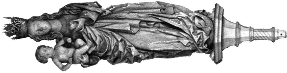
c) MADONNA, Holz. Beinhaus St. Michael, Zug.