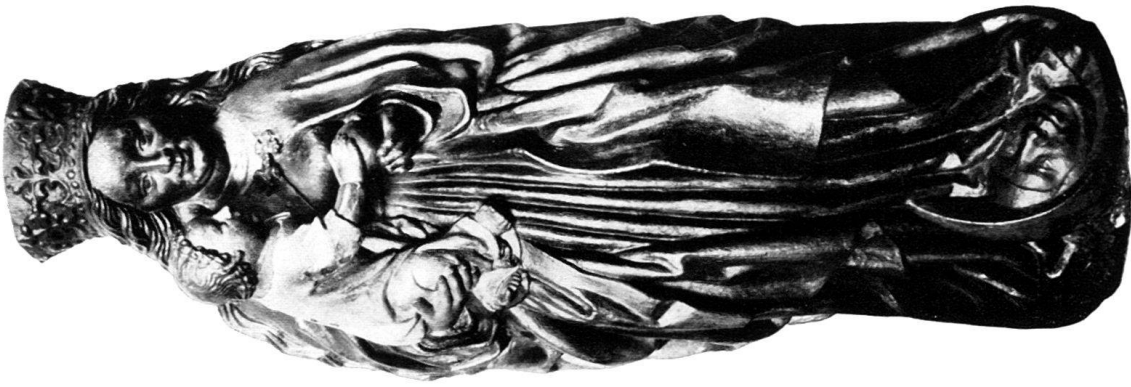
a) MADONNA, Sandstein, aus Luzern. Landesmuseum.