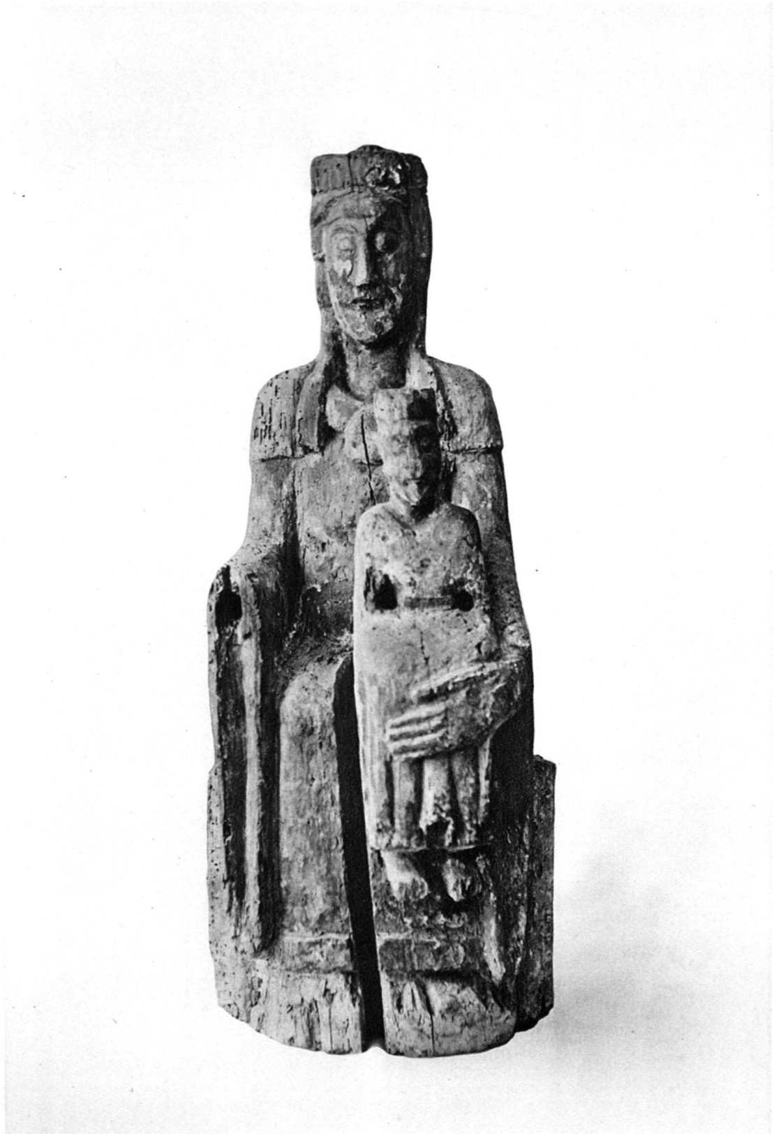
Maria aus Einsiedeln Holz Einsiedeln, Sammlung Birchler