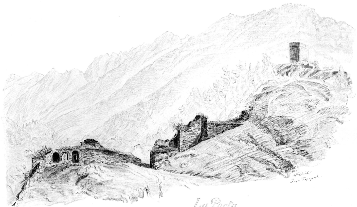
La Porta. Vai Bregaglia.