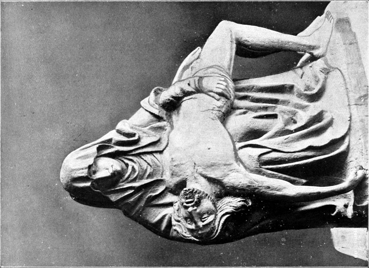
a) Beweinung Christi. Freiburg i. Ü., historisches Museum.