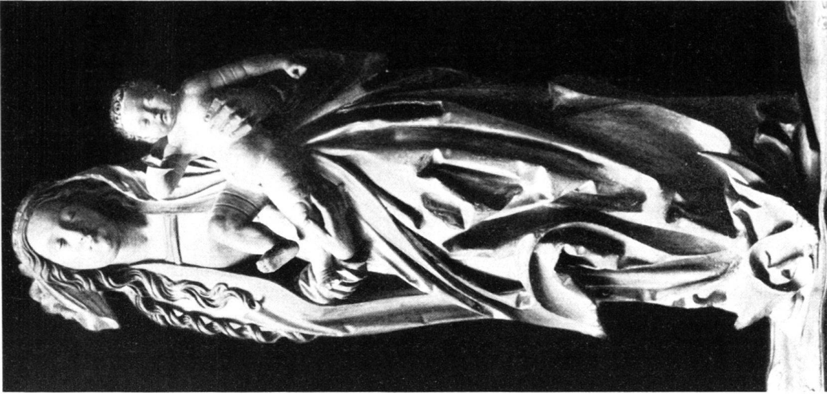
b) Madonna aus Berner Privatbesitz.