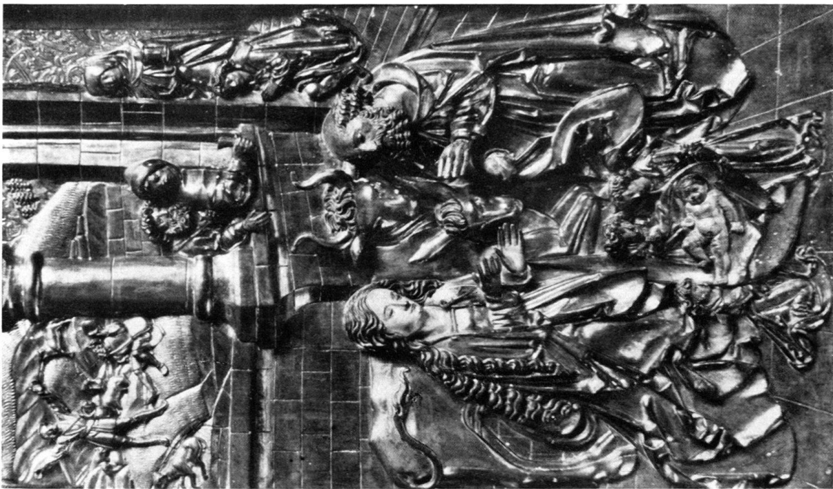
a) Geburt Christi vom Furnoaltar (Taf. XVII, a).