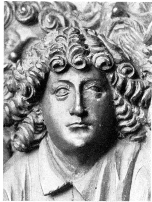
b) Maria und Johannes aus der Himmelfahrt Christi (Taf. XVII, b).