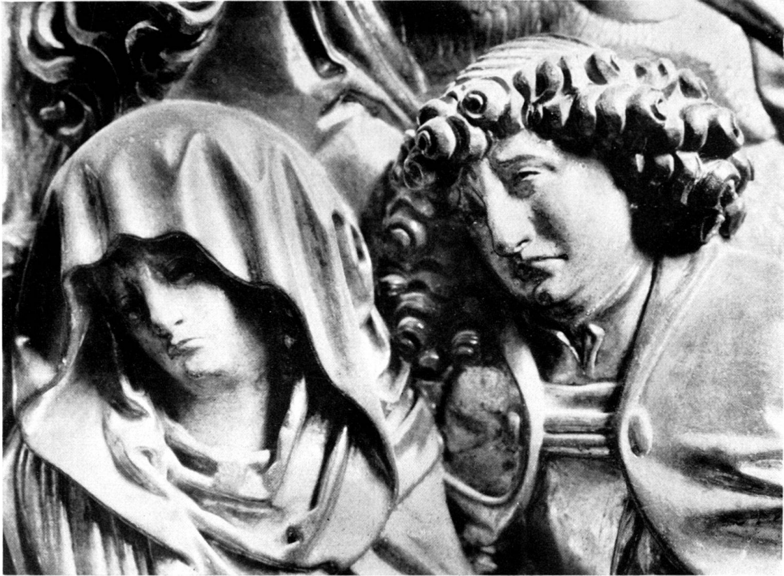
a) Maria und Johannes aus der Kreuzigung des Furnoaltars (Taf. XVII, a).