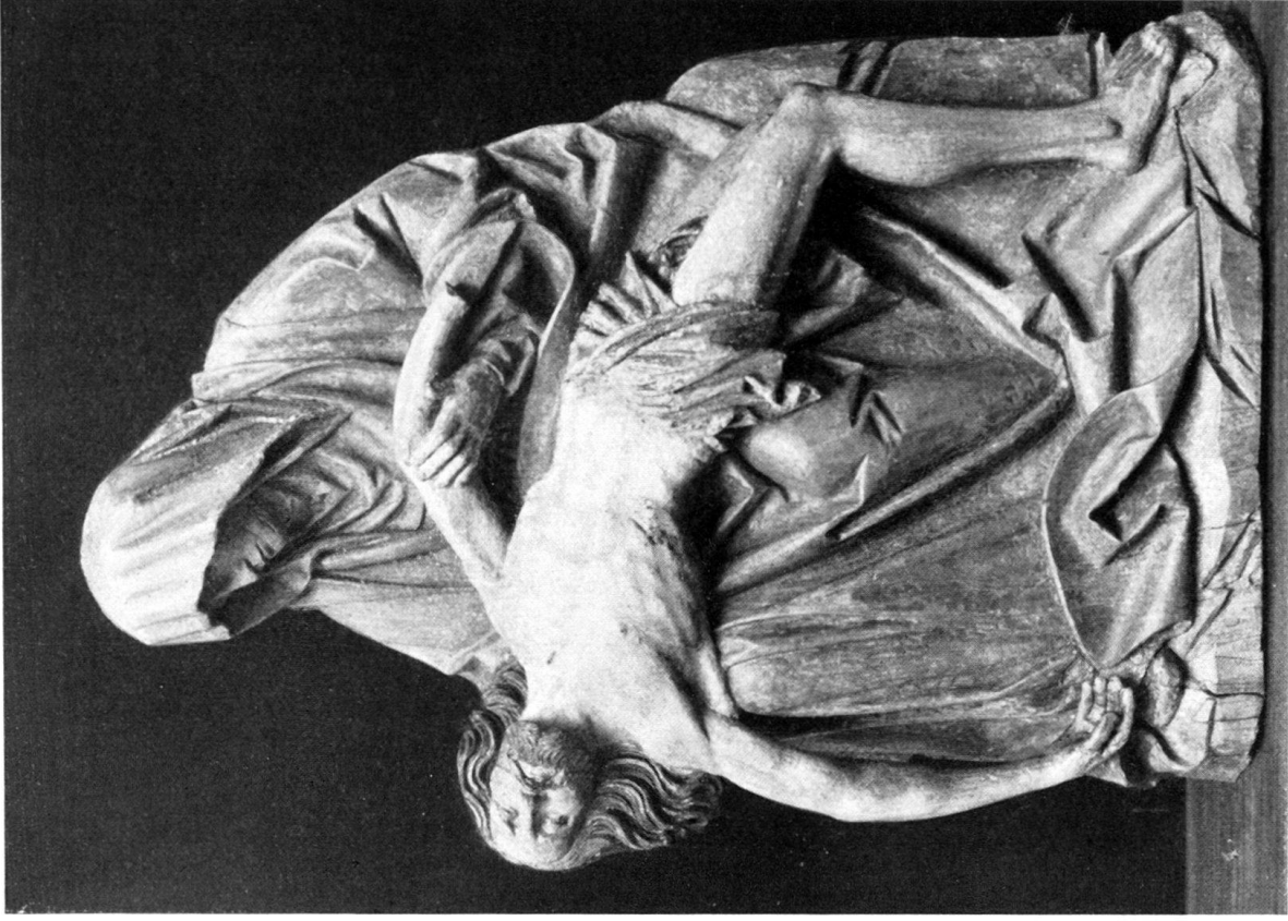
b) Beweinung Christi. Basel, historisches Museum.