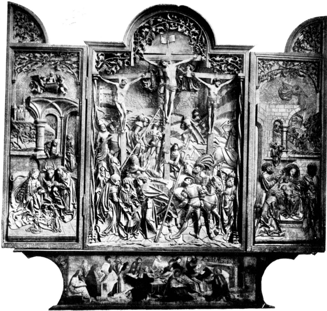
a) Furnoaltar. Freiburg i. Ü., Franziskanerkirche.