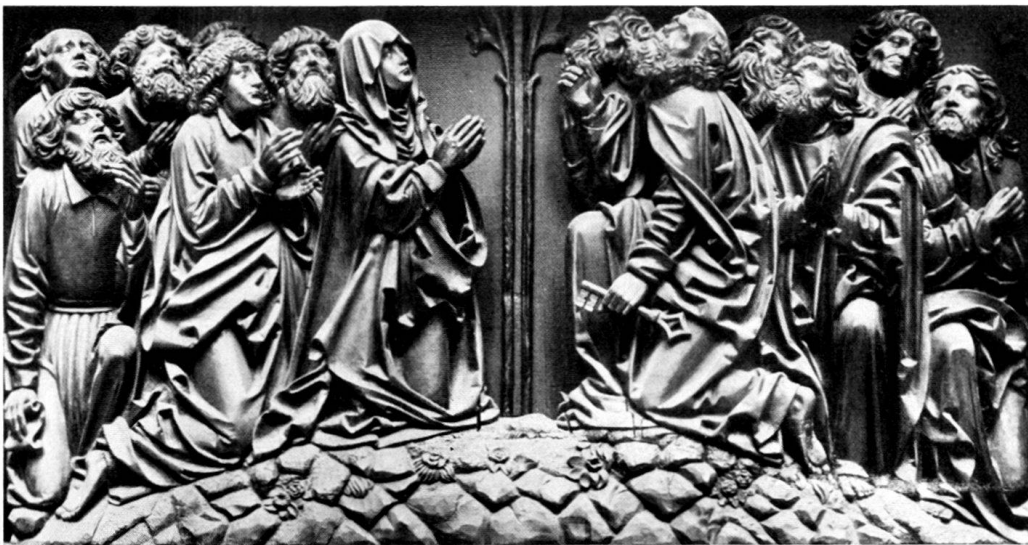
b) Himmelfahrt Christi. Basel, historisches Museum.