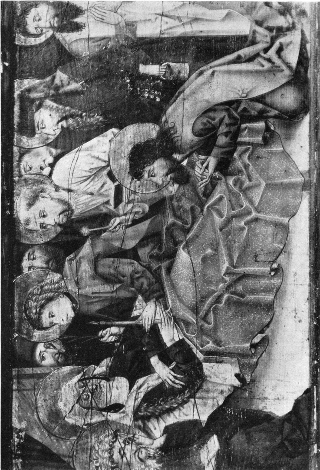
Detail der Predella.