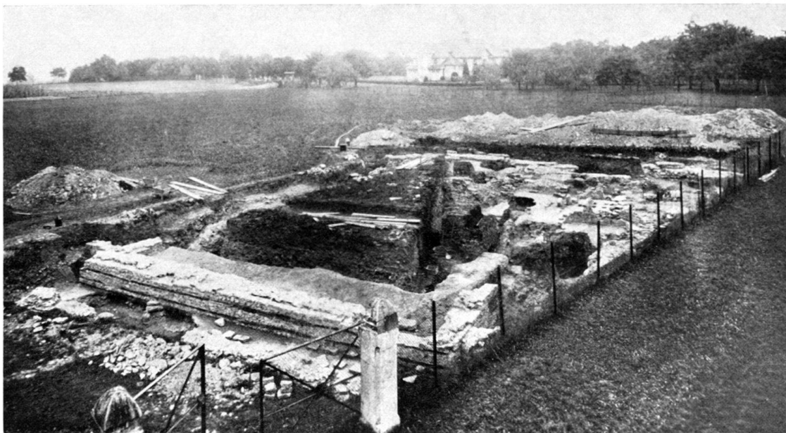
Abb. 1. Grabung 1929, Übersicht von W.