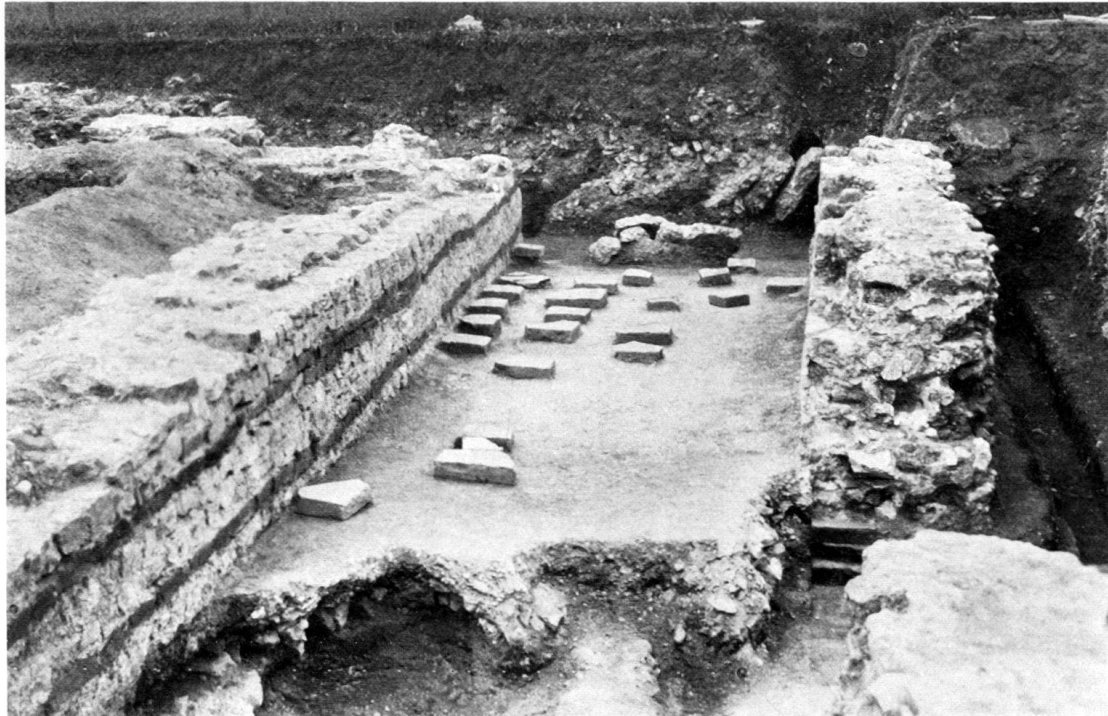
Abb. 2. Raum F von Norden.