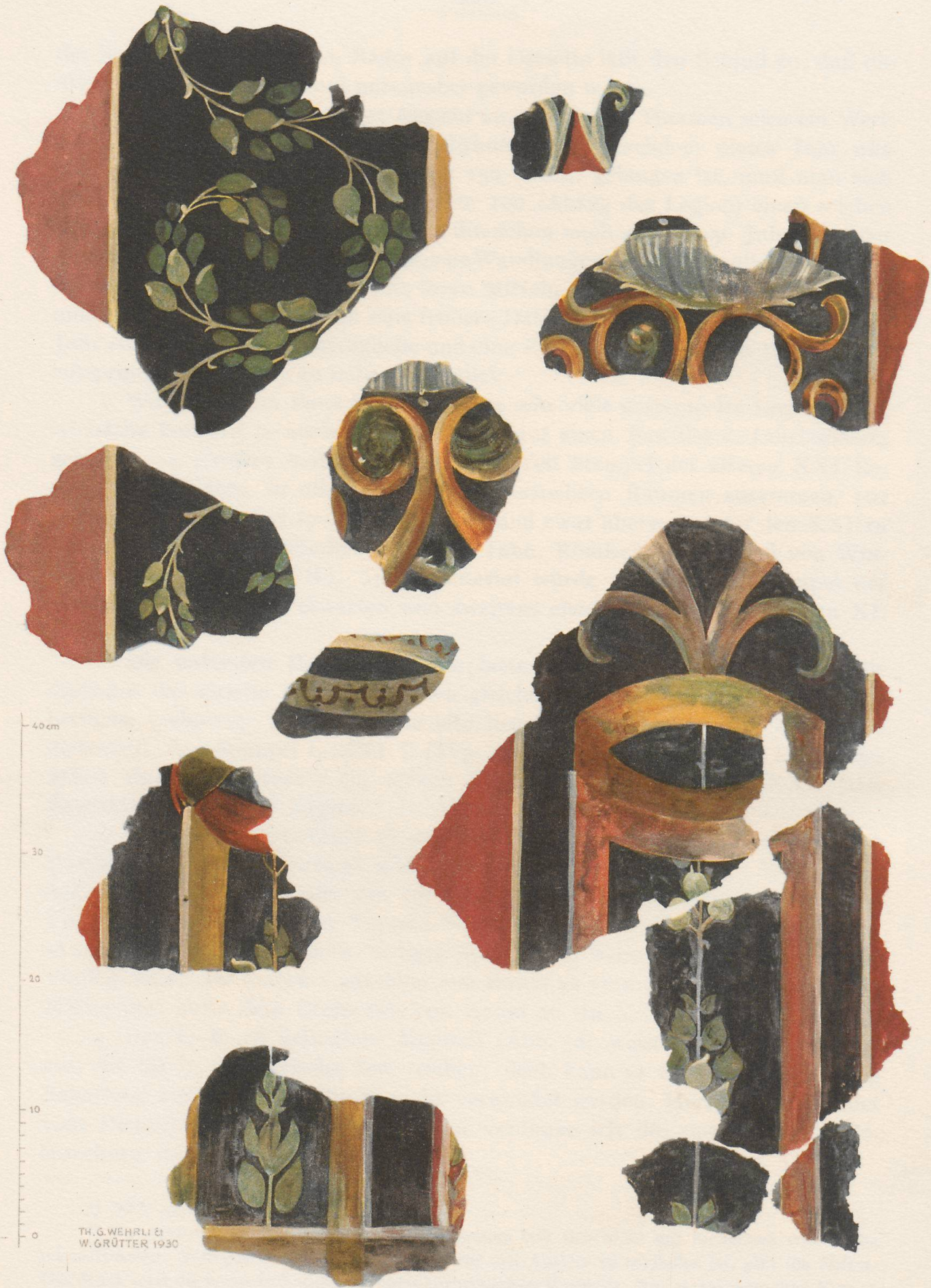
WANDMALEREIEN AUS DEN THERMEN VON VINDONISSA