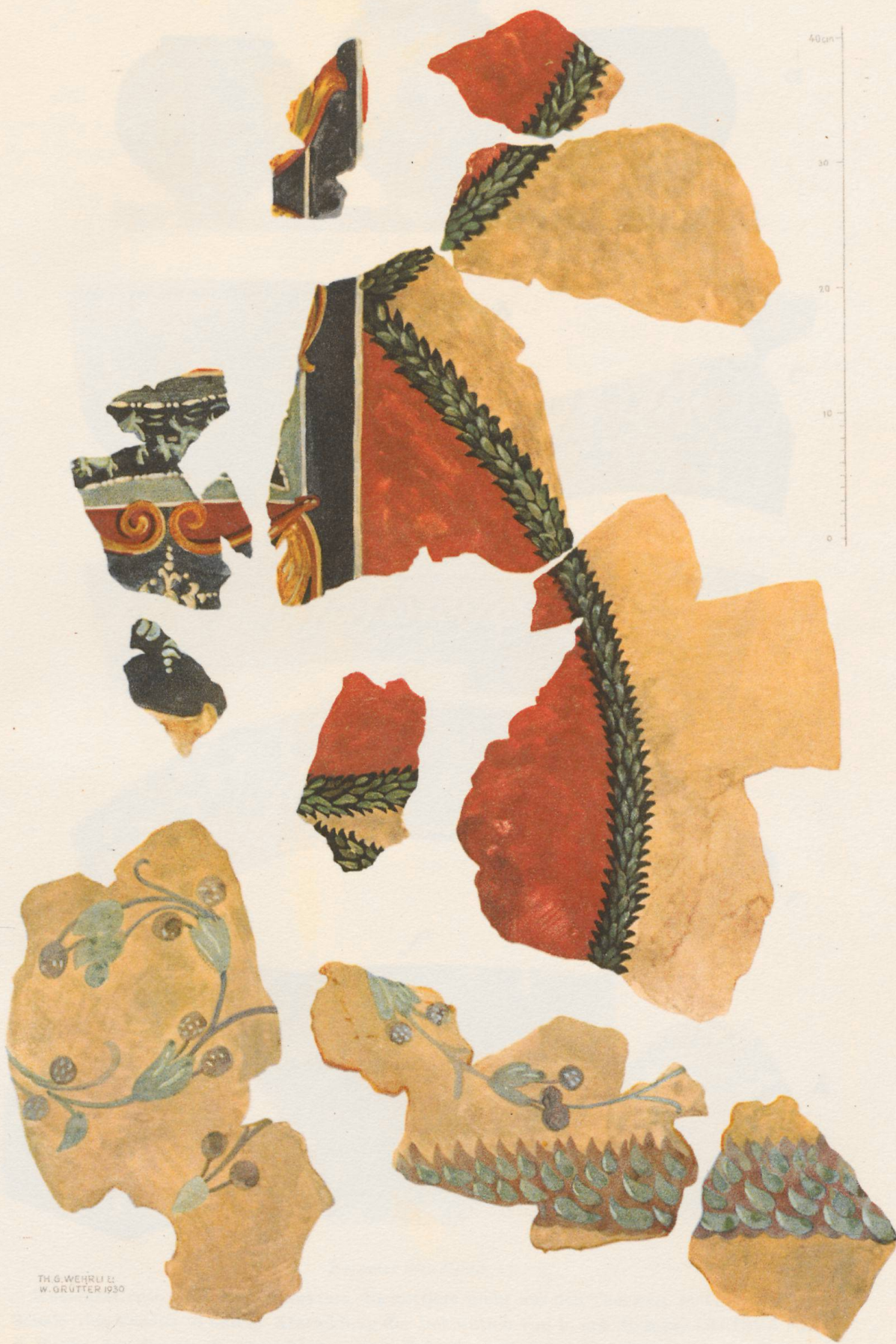
WANDMALEREIEN AUS DEN THERMEN VON VINDONISSA