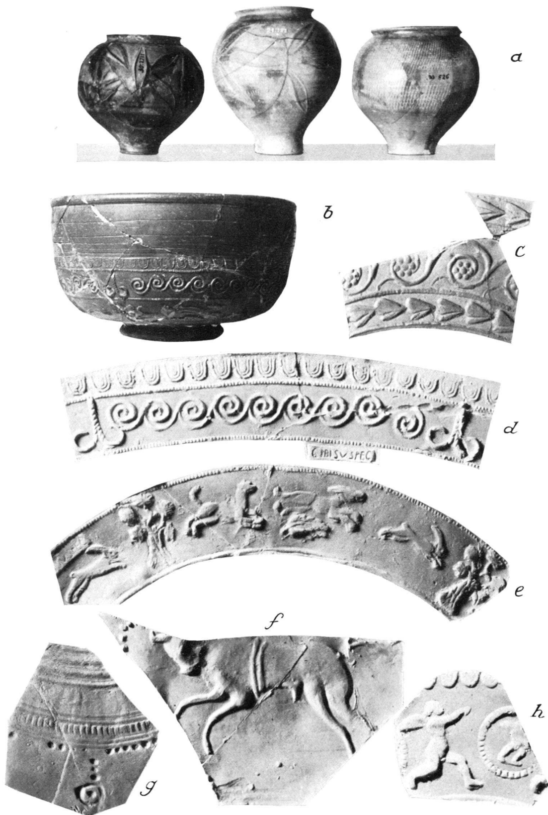
Keramik aus Raum 17.

a) Kugelige Urnen rätischen Charakters, die mittlere nicht aus den Thermen. b) Terra sigillata-Schale des Cibisus. d und e) Abwicklung der Dekoration von b, mit Stempel CIBISVS FEC. c) Ranke des Janus. f) Abwicklung einer Scherbe mit Barbotine-Dekor, einen springenden Stier mit Gurtband darstellend. g) Randstück zu f, oben anpassend. h) Terra sigillata-Scherbe des Cibisus mit geriefeltem Eierstab. (Die Gefäße 1:4, die Abwicklungen 1:2.)