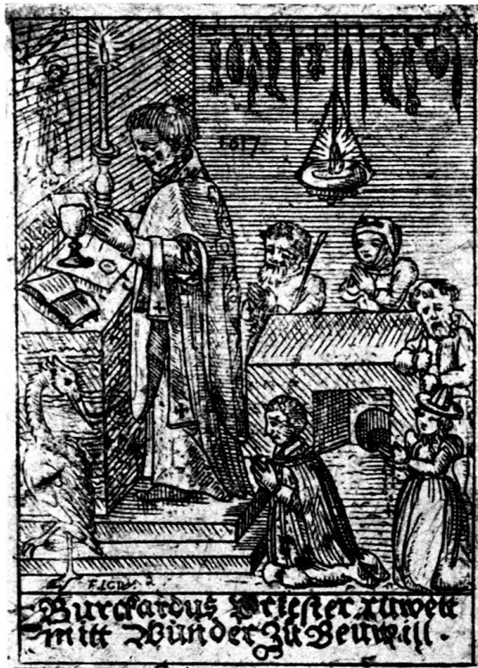
Abb. 2. P. Johann Kaspar Winterlin. Bildnis des hl. Burkhard von Beinwil, 1617.

Auf dieses Blatt folgt zeitlich der St. Burkhardusstich. Dieser zeigt einen am Altar stehenden, messelesenden Priester, der wohl Burkhardus vorstellen