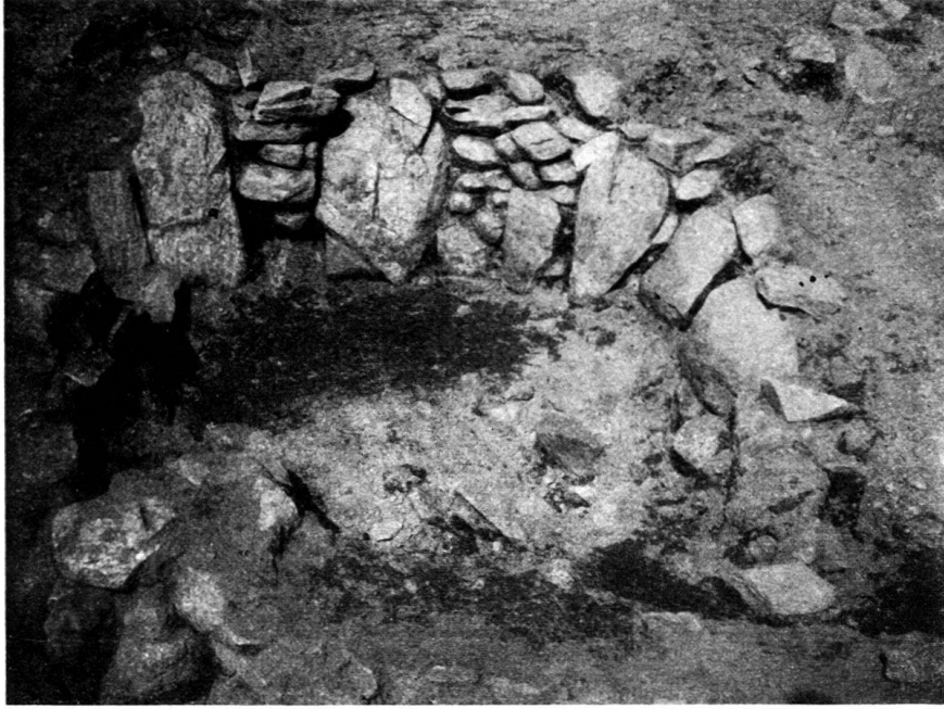
Abb. 5. Raum A. Links unter der großen Steinplatte der Schwellenstein, vorn der Herd.