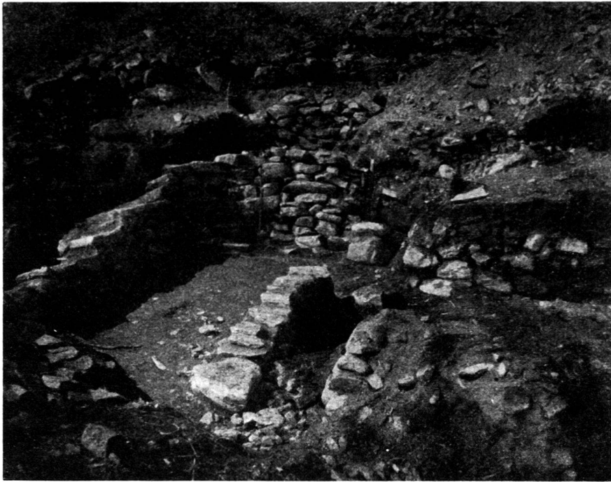
Abb. 3. Raum B von Süden. Castaneda. Grabung 1931.