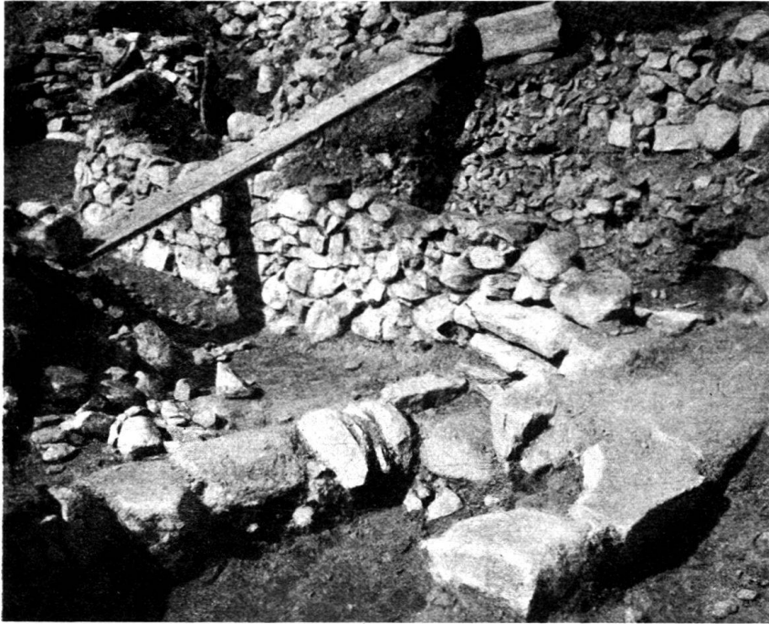
Abb. 1. Hinterfront von Raum C. Vorne die Seitenmauern op und rq.