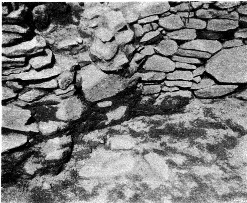
Abb. 4. Raum D. Ansatzstelle des Rechteckbaues der 2. Periode an den Rundbau der 1. Periode. Unten Herdstelle. × Höhe des Fußbodens der 2. Periode.