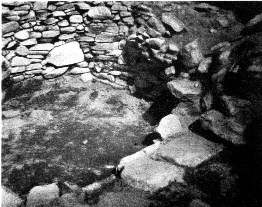
Abb. 2. Rundbauteil des Raumes D. Im Vordergrund Schwelle, Mitte links Herdstelle. Boden der I. Periode.