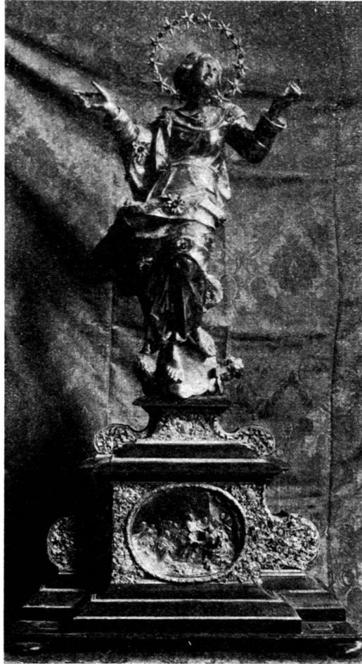
Fig. 2. Das Bruderschaftsbild vor der Renovation.

Am 26. April 1693 wird gemeldet, daß in das neue Kästchen verschlossen worden seien: 30 neue Kronen und 17 Batzen an Geld, die an das silberne Marienbild verehrt wurden; außerdem ein silberner Gürtel und ein goldener Ring mit einem Saphir. Hauptmann Urs Sury vergabte daran altes Silbergeld im Werte von