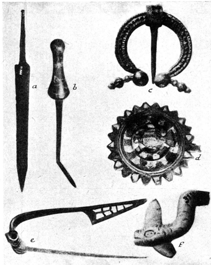
Abb. 17. a) Eisenschwert, Länge: 66,5 cm, gefunden nördlich von R; b) Stechheber aus bräunlichem Glas, L.: 50 cm, Grube 8; c) Fibel aus Bronze, Dorn 21 mm lang, Streufund; d) Scheibenfibel mit Emaileinlagen und in der Mitte aufgesetztem Vögelchen, Durchm.: 4,5 cm; e) Fibel aus Bronze, Spät-Latène, Länge: 10,7 cm, Gr. 25; f) Vorderteil einer Schlange aus Bronze (von einem Kultgefäß), Länge: 6 cm, bei Gr. 1.

und Teile von solchen, 20 Ringe, 4 Siegelkapseln, 1 Glöcklein, 1 massive runde Fassung, abgeplattete Kugeln, mit Blei ausgegossen (Gewichte?), Siegelkapseln, Schloßriegel, Schnallen, Gürtelbleche, Nägel usw.