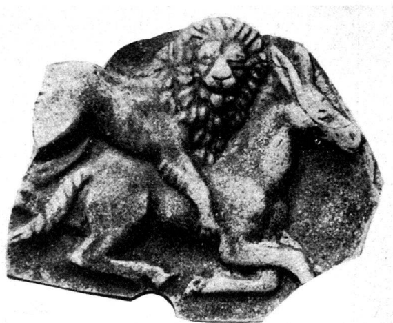
Abb. 20. Lämpenspiegel (vergrößert) gr.-Dm. 4,8 cm, Grube 43.

Grube 29: Zwei Lampen mit seitlichen Handhaben, drei Lampen mit verschwommener Darstellung: Gladiatoren? Ziege und Affe?; Lampe: Reiter mit Handpferd; Lampe: Hirsch vom Hund angefallen, Henkel, Bodenstempel \begin{matrix} CIIIIR \\ XIII \end{matrix} , dazu vier Böden mit demselben Stempel. Je ein Exemplar fand sich auch in Grube 36 und 43; sonst ist er bei uns unerhört. Kleine graue Urne; arretinischer Stempel CRESTI (Monogramm); Augustusmünze. Kiefer und Zähne vom Rind, Schwein, Ziege oder Schaf, Oberkiefer von Rind, Schädelteile von Schaf, weitere Knochen.