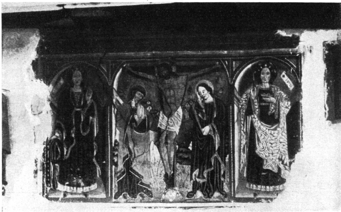
Abb. 5. Curaglia. Kreuzigung, St. Katharina (l.) und St. Lucia (r.). Arbeit von Antonius de Tredate, 1510.

Das Christophorusbild am Turm der alten St. Martinskirche in BRIGELS wurde im Sommer 1930 einer Erneuerung unterzogen. Nachdem eine Untersuchung ergeben hatte, daß die Figur so verwittert war, daß eine Restauration unmöglich erschien, entschloß man sich für eine ganz neue Figur im spätgotischen Charakter, aber modernisiert; als Vorbild diente der Christophorus von Platta. St. Martin besitzt eine Holzdecke mit prächtigen spätgotischen Holzschnitzereien und einem Flügelaltar von 1518 1) .