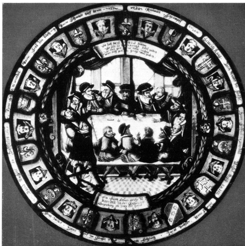
Abb. 3. Rundscheibe des Gerichts zu Peterzell, 1620. (Nr. 6) Schweizerisches Landesmuseum Zürich.

Tuschzeichnung, sign. H. J. Nüscherer, 1618 (Nr. 3) Schweizerisches Landesmuseum Zürich.