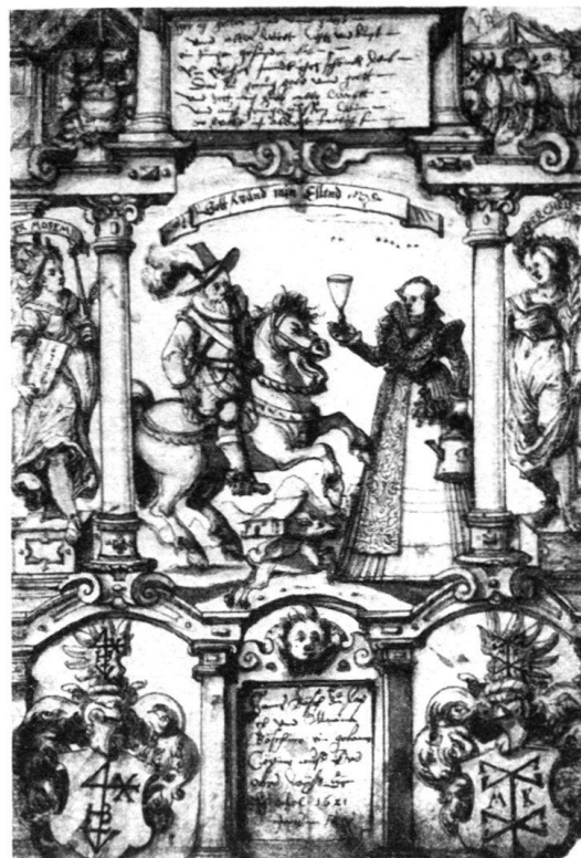
Abb. 6. Scheibenriß zu nebenstehender Scheibe.

(Nr. 15) Staatliche Kunstbibliothek Berlin.