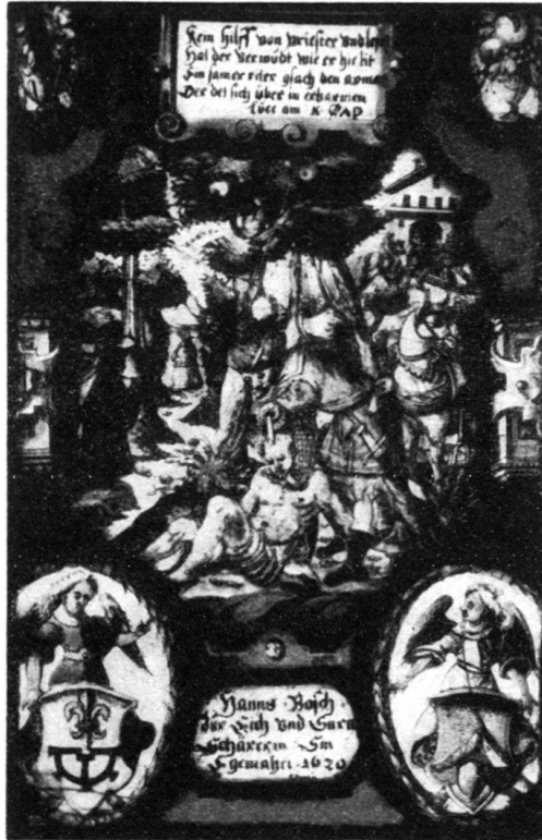
(Nr. 10) Privatbesitz Zürich