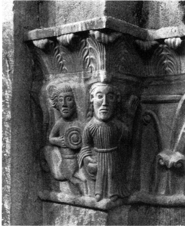
Abb. 5. Chur, Dom. Kapitell am östl. Langhauspfeiler der Nordreihe. Centaur, als Tod und Frau.

biblisch im Stabe Aarons und legendär im Stabe Josephs zu erkennen ist. Die sogenannte heraldische Lilie, die Lilienzier auf Zepter und Krone ist nichts anderes als das ursprüngliche Lebenszeichen. Die Krone war ein Kranz, ein grüner oder blühender Zweig. Das Zepter war ein Hirtenstab, Botenstab, seine Zier aber geht auf die lebenspendende, wunderwirkende, grüne Rute zurück. Man traute den Herrschern von Gottes Gnaden Heilkraft zu, und sie übten die Handauflegung aus. Der Dreisproß, die Lebensrute in der Hand von fürstlichen Personen sagt von Segensmacht, hoher Abkunft, bezeichnet den Träger als Sprossen aus altem Adel. In der Hand des Verkündigungsengels ist das grünende Reis der lebendige Botenstab, deutet auch den Inhalt der Verkündigung an: Siehe, du wirst empfangen ..., in der Hand Mariä bedeutet es die königliche Abkunft, die Auserwählung und die Mutterschaft. Die Beispiele in der romanischen Kunst sind zahllos, wo Maria oder irgendein profanes Herrscherbild nur den stengellosen Dreisproß in der Hand hält. Die gleiche Figur dient als Bild der Dreiflamme, Leben und Feuer haben gleiche magische und symbolische Bedeutung. Blätter können Flammen, Dreiblätter um Taufbecken dämonische Vorstellungen anzeigen. Die Löwen und Drachen speien Feuer in Dreiblattformen aus, und ihre Schwänze endigen in diesem Zeichen. Auch «Frankreichs Lilien» haben ihren Ursprung in weniger süßen Abwehrzeichen. Doch von diesen Dingen kann hier nicht eingehend gehandelt werden.