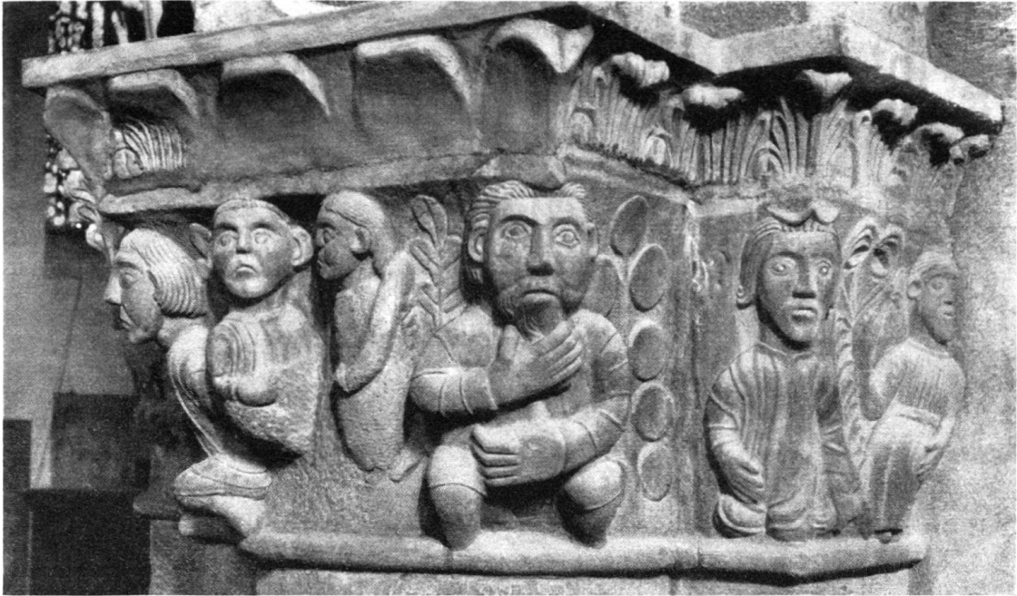
Abb. 4. Chur, Dom. Scheidbogenkapitell des östl. Langhauspfeilers der Nordreihe. Strafgericht und Verheißung.