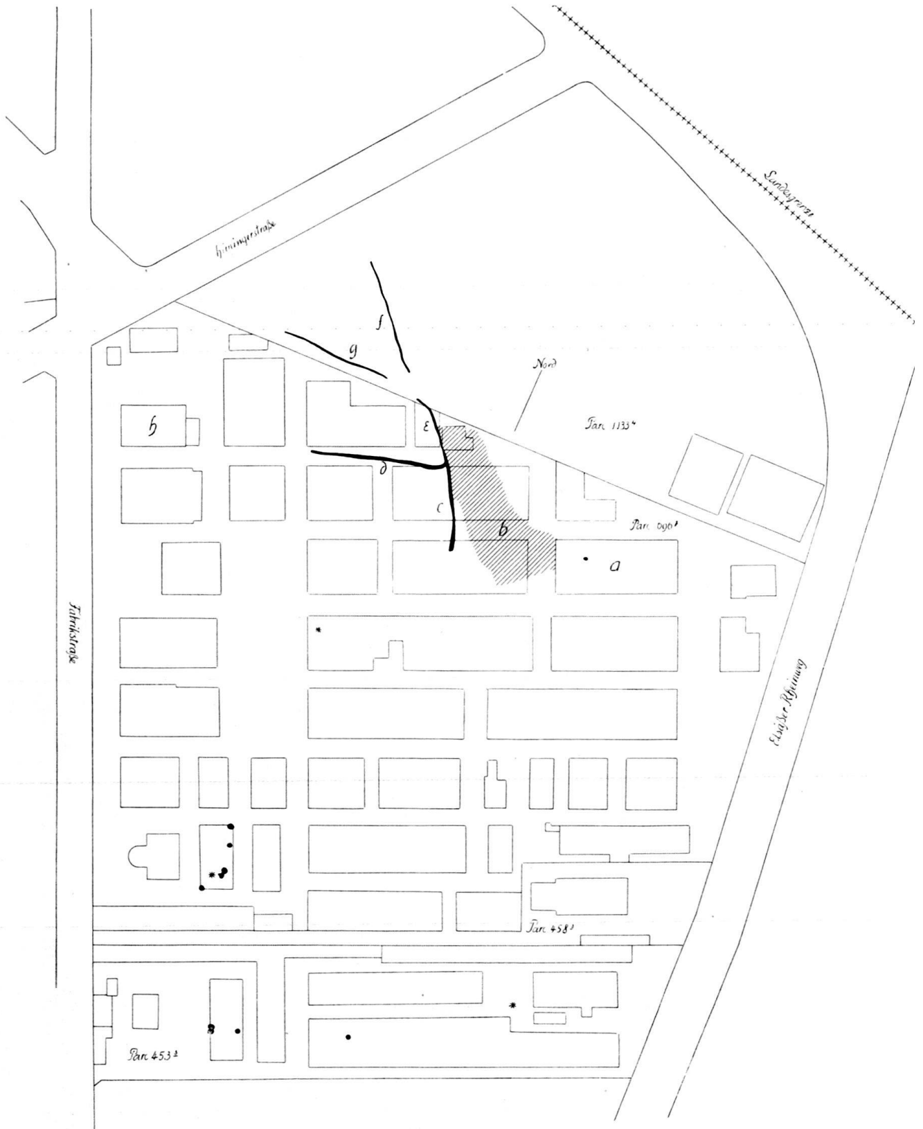
Abb. 2. Situationsplan der Grundstücke Durand, Sandoz und Rheinhafen. 1 : 2500.