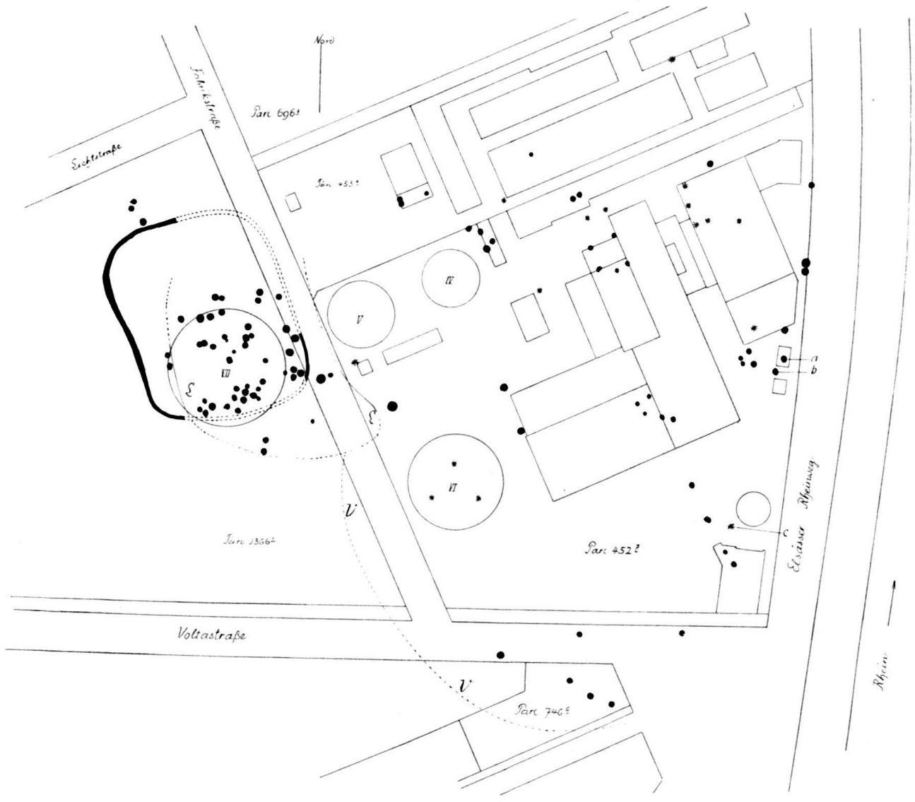
Abb. 1. Situationsplan der Gasfabrik. 1 : 2500.