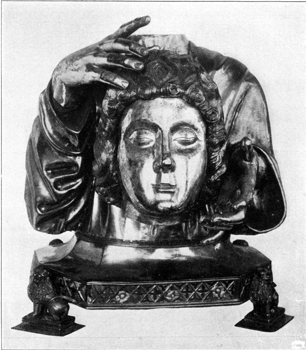
Abb. 17. Spätgotisches St. Justusreliquiar aus Flums im Schweiz. Landesmuseum. Klischee aus Dr. Anton Müller, Geschichte der Herrschaft und Gemeinde Flums, Goßau 1916, S. 51.

recht aufgenommen wurde 12) . Im obigen Texte wolle man ein Satzzeichen beachten: beim pathetischen Ausruf «Erro» wird nach spanischer Orthographie das Satzzeichen zweimal gesetzt, zu Anfang verkehrt, ebenso bei «hinc».