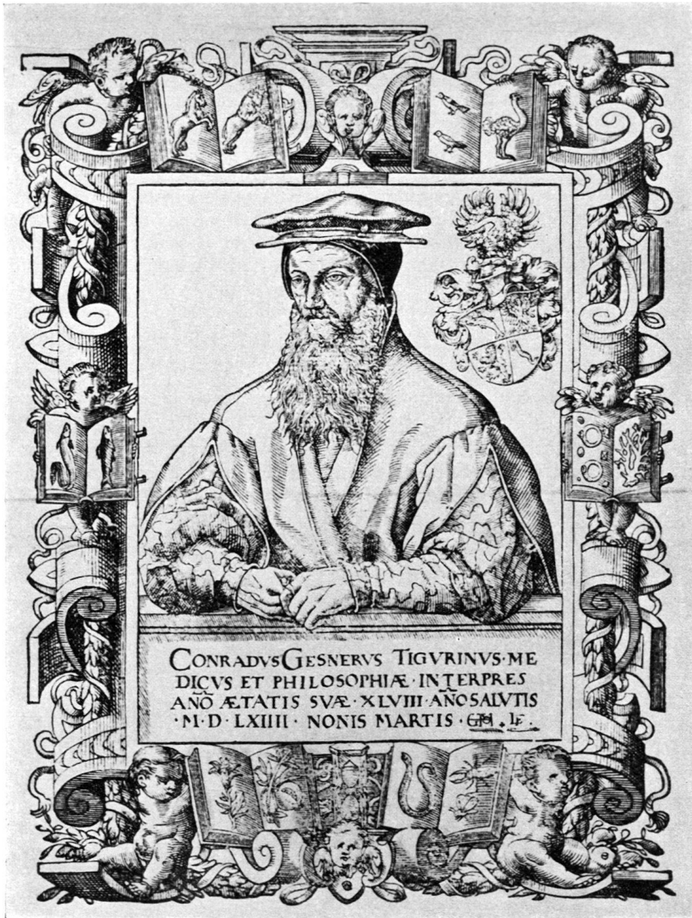
Abb. 3. Großhans Thomann: Holzschnittbildnis des Conrad Gessner. Geschnitten von Ludwig Fryg.