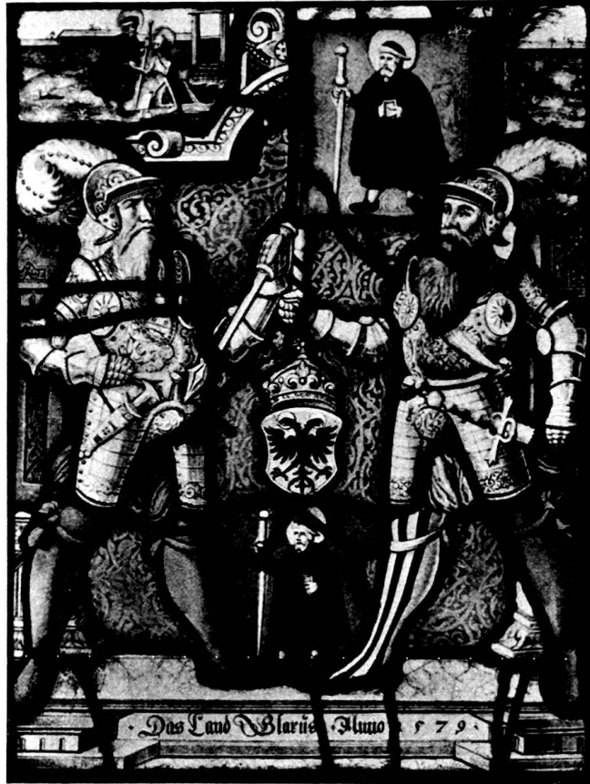
Abb. 12. Standesscheibe Glarus, 1579 (Nr. 193)

195. Rundscheibe Stadt Zug, 1671. Dm. 18. Mit doppeltem Wappen und Inschrift Stadt Zug 1671 . Darunter in einer Reihe die Wappen und Namen der sechs Vogteien.