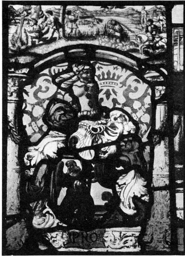
Abb. 11. A Pro, Seedorf (Uri) und Fragmente (Nr. 170)

pen, dahinter blaugekleidete Frau als Schildhalterin. Inschrift: Wendell. Schwmacher. 1571. — HBL Luzern Nr. 5: Vogt zu Malters und Mendrisio, † 1611. S. auch v. Vivis, Archiv f. Heraldik 1909, S. 74, Anm. 2; das Wappen auf der Scheibe ist Nr. 80 auf Tafel VI, aber mit einem gelben Stern zwischen den Sichel.