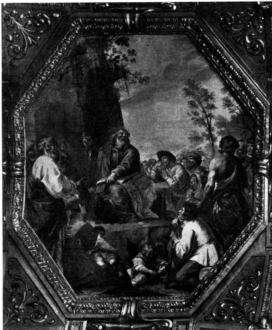
Fig. 4. La predicazione di S. Matteo, di Giovanni Battista Carlone, nella Basilica della SS. Nunziata del Guastato in Genova

nunziata 33 ); la donna seduta in primo piano col bambino in braccio, il giovane contadino inginocchiato di fronte a lei, quello ritto dietro di esso ed appoggiato al rialto su cui sta l'apostolo riproducono, l'ultimo soprattutto, volti, pose, atti delle corrispondenti figure genovesi in maniera sorprendente; quasi identico poi è lo sfondo.