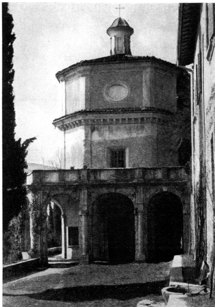
Fig. 1. Oratorio di S. Antonio da Padova. Morcote

Tuttavia il pregio maggiore dell'edifizio, più che nella grazia architettonica e nella felice ubicazione, mi pare che sia nelle pitture a fresco che ne decorano l'interno, inosservate dai più. Esse hanno destato il mio interesse in modo particolare; e mi sorprende, non so se a torto o con ragione, che poco conto se ne sia fin qui fatto. Varchiamo la soglia ed osserviamole.