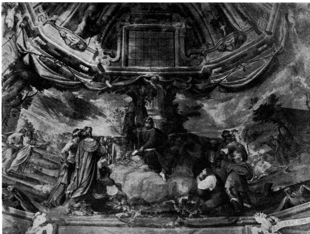
Fig. 5. Oratorio di S. Antonio da Padova. Morcote Affreschi di Giovanni Carlone: scena III (nel mezzo), IV (a destra), II (a sinistra)

nella volta mediana: grande composizione, la quale, compiuta intorno al 1670, viene meritamente posta fra i capolavori di Giambattista 34 ). Il tipo di Pietro, in questo e negli altri episodi della sua vocazione e della caduta di Simon Mago, ricompare a Morcote; vero è ch'esso rammenta il tipo tradizionale.