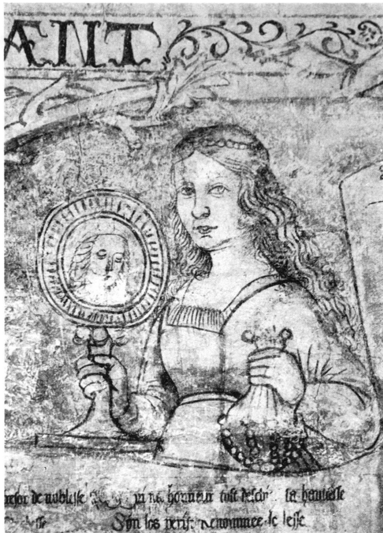
Fig. 2. Paroi sud. Figure illustrant la vertu «Honneur». La présence du miroir et de la bourse, attributs contradictoires du point de vue allégorique, est motivée par le texte accompagnant la figure

au peintre par le sujet qu'il eut à interpréter tout d'abord: les 13 ballades en vers du «Bréviaire des Nobles». Toutes les figures personnifient des vertus, et s'il faut donc bien les appeler allégoriques, il faut noter aussi leur caractère moderne relativement à l'époque à laquelle elles appartiennent. La plupart sont de gracieuses jeunes femmes, vêtues et coiffées comme les contemporaines du peintre.