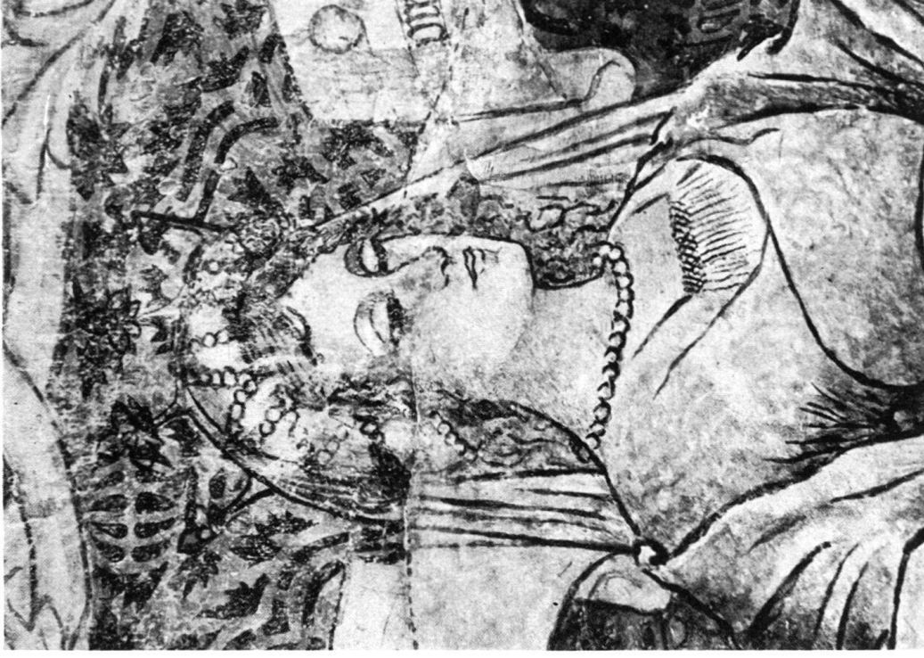
Fig. 5. Paroi nord. Cette effigie, d'un charme réel, pourrait se nommer «la pelle pensive». La sûreté du trait est ici remarquable et la pose originale de la figure demeure unique dans les fresques