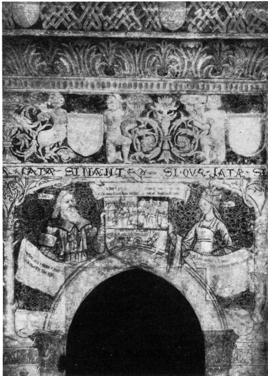
Fig. 1. Vue d'ensemble et 1 er panneau de la paroi nord; Adam et Eve, représentés en dignes bourgeois de l'époque, présentent l'écusson où se trouvent figurées les diverses conditions sociales

Les figures du registre principal se détachent sur un fond de motifs gothiques. Entre la frise et les panneaux à figures court un listel répétant la devise de l'évêque Aymon de Monfaucon : «SI QUA FATA SINANT.» Dans chacune des deux parois du vestibule s'ouvrent trois portes ogivales qui modifient les dimensions de certains panneaux.