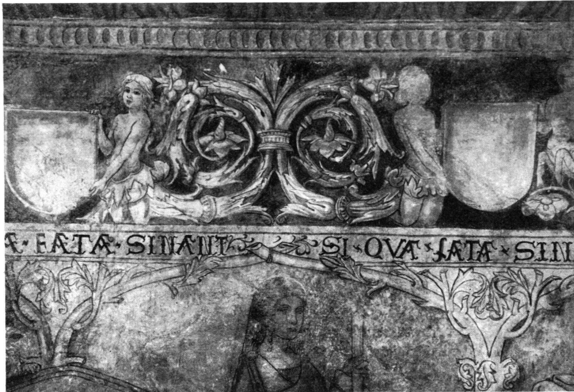
Fig. 7. Section de frise (paroi sud). La gracieuse figure incorporée au rinceau est d'une conservation parfaite. De même, le fond rouge foncé original, sur lequel se détache dans tous ses détails le rinceau en grisaille

Restaient les figures elles-mêmes et particulièrement leur costume. Les unes et les autres sont dans cette note «moderne» qui devait plaire à l'évêque amateur de nouveautés. L'élégance désincarnée des silhouettes gothiques a vécu, les bustes sont pleins, les visages détendus et souriants. Ainsi qu'il sied à des «Dames de Vertu», la bizarrerie des coiffures n'évoque que modérément les extravagances vestimentaires de la fin du XV e siècle. Ars nova! ars nova! Mais si l'on considère par ailleurs, le caractère didactique et allégorique de l'œuvre dans son ensemble, ce mélange du nouveau et de l'ancien révélera bien l'époque de transition qui, hors d'Italie, précède la Renaissance.