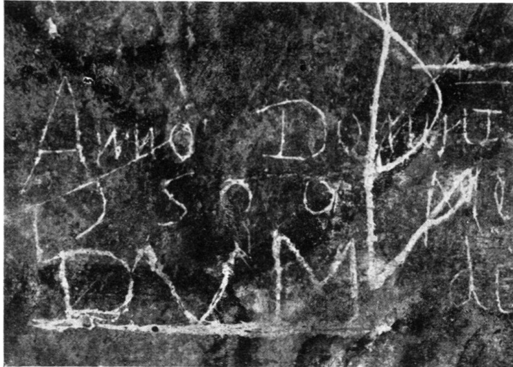
Fig. 8. Graffite pratiqué à la pointe du stylet à la paroi sud. La date 1500 qui figure ici fait forcément remonter les fresques lausannoises aux dernières années du XV e s.

en date du 13 février 1513, rappelant «que le vénérable frère Aymon de Monfaucon déclarait depuis 15 ans vouloir décorer sa cathédrale d'ouvrages plus beaux et dans le goût moderne» 10) . Or, si le distingué prélat préconise dès 1498 le style nouveau même en matière d'art religieux, combien plus ne devait-il pas lui avoir fait une place dans sa résidence privée? Une œuvre «moderne» se trouvait alors déjà dans son décor familial: les fresques du vestibule du château. Le graffite daté 1500, cité plus haut, est venu corroborer cette opinion. Et si dans ces fresques l'évêque se montre soucieux de transmettre de nobles avis, il s'y révèle aussi, du point de vue culturel, tourné vers ces dévotions nouvelles qui, hors d'Italie, sont alors pour les avant-gardes, aube d'humanisme. Le premier dans nos parages, Aymon de Monfaucon accueille, avec la frise Renaissance, une œuvre «à l'antique» telle qu'il n'en existait encore aucune au nord des Alpes. Elle nous apporte un nouveau et précieux témoignage de sa munificence.