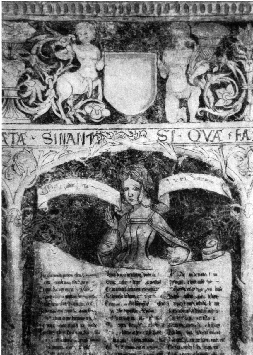
Fig. 6. Section de frise et panneau de la paroi nord. Aux parchemins couverts de textes s'ajoutent ici des banderoles avec citations de la Vulgate

Le 9 e panneau ne nous offre plus qu'une effigie pâlie, l'un de ces «cornus visages» qui déplaisaient au poète Eustache Deschamps, puisqu'il écrivait: «Cornes portez comme font les limaces», reprochant ainsi aux dames une mode qui, malgré tout, devait avoir longue vie. Si peu attrayante qu'elle soit, elle complète à merveille le catalogue des coiffures de nos «dames du château».