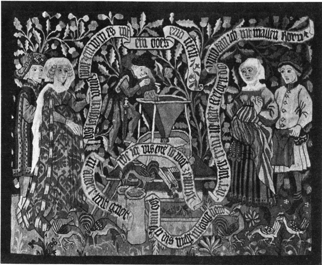
Abb. 1. London, Sammlung Sir William Burrell Bildteppich mit dem unredlichen Müller

bewachsenen, von kleinen Tieren belebten Bodengrund zu vergleichen. Wie dort das Weinspalier bilden hier lebhaft geschwungene Eichenranken den tapetenartigen Abschluß. Die Musterkarte der Farbtöne stimmt ebenso überein wie Material und Technik. Auch finden Form und modische Differenzierung der Gewänder vielfältige Analogien. So kehrt das streifenförmig schattierte Kleid der Bäuerin mit den die Brüste markierenden weißen Kreisen, dem Röhrenfaltenrock und dem aufgeschlagenen Obergewand bei der zweiten Dame des Liebesteppichs wieder. Während das pelzbesetzte reichgemusterte Kostüm der Dame auf dem Müller-Teppich in der Zeittracht der schachspielenden Königin ihr modisches Gegenstück erkennen läßt 4) (Abb. 2).