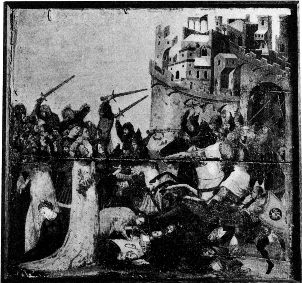
Abb. 1. Tafelbild mit Szene aus der Ursulalegende, aus Rovio, um 1440 Zürich. Schweiz. Landesmuseum

Diese Szene stimmt nun bis in die Einzelheiten genau mit dem linken Flügel eines Triptychons überein, das sich heute (als Leihgabe der Uffizien) in der Pinakothek zu Arezzo befindet. Der ganze Altar — die Arbeit eines toskanischen Provinzmalers vom Beginn des 15. Jahrhunderts — stellt in der Mitte die Kreuzigung, links die Ankunft der hl. Ursula in Basel und rechts eben unsere Szene, das Mar-