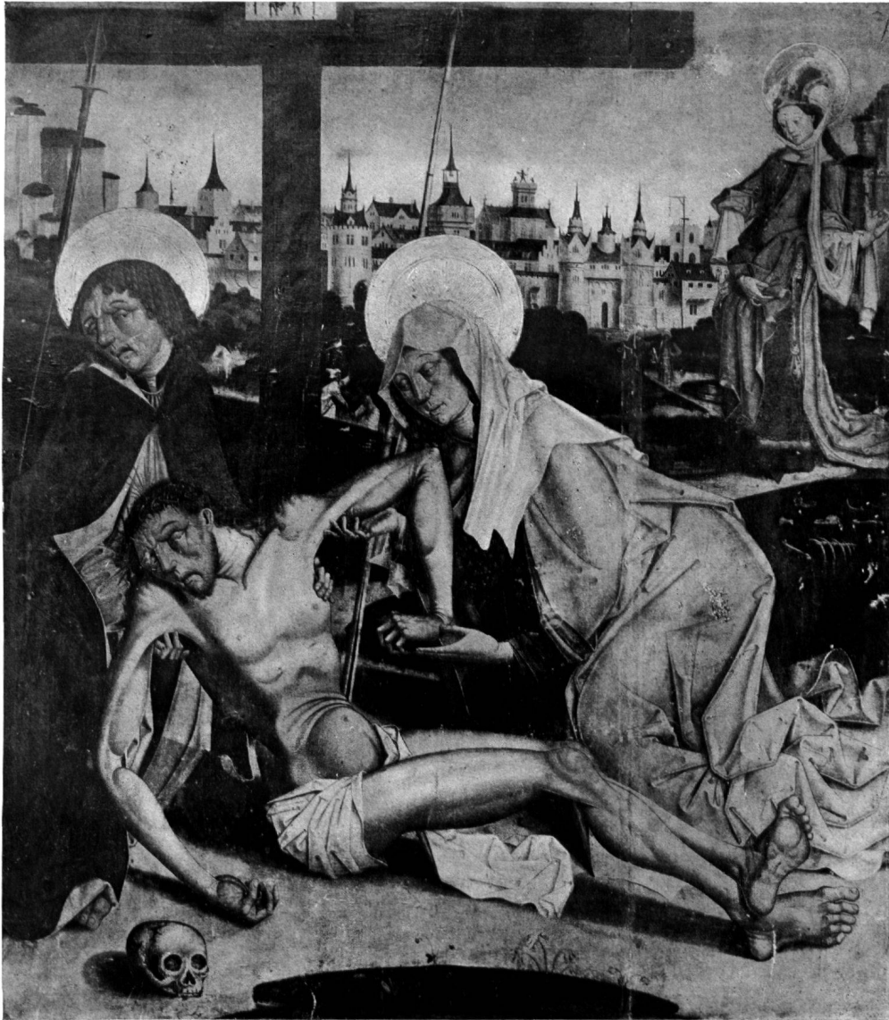
Abb. 1. KREUZABNAHME, AUS UNTERSEEN Sarnen, Kloster St. Andreas