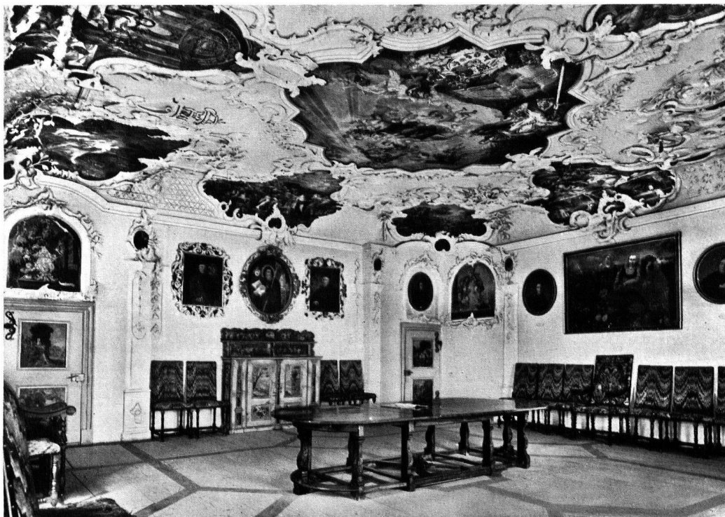
Schloß Sonnenberg (Kt. Thurgau), Festsaal. Vgl. Nachrichten S. 69