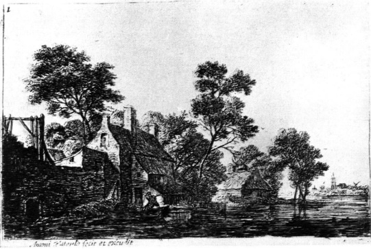
Abb. 1. Radierung von Anthonie Waterloo (1610?—1690) Die Rückkehr des Fischers