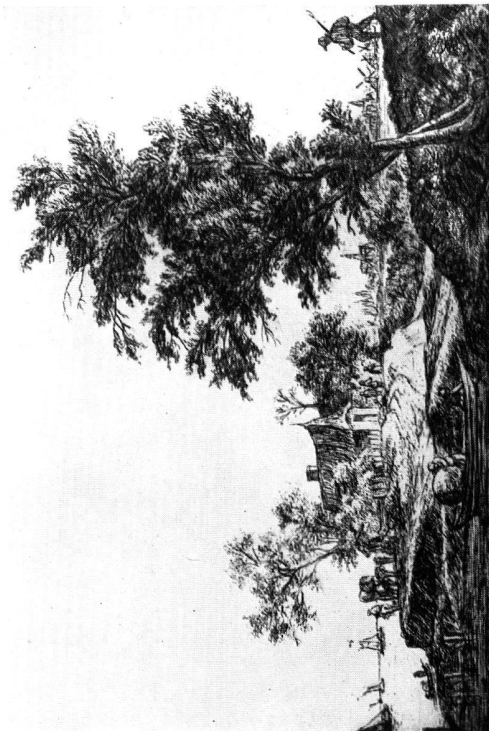
Abb. 5. Anthonie Waterloo (1610?—1690). Die Hütte auf dem Hügel, um 1650