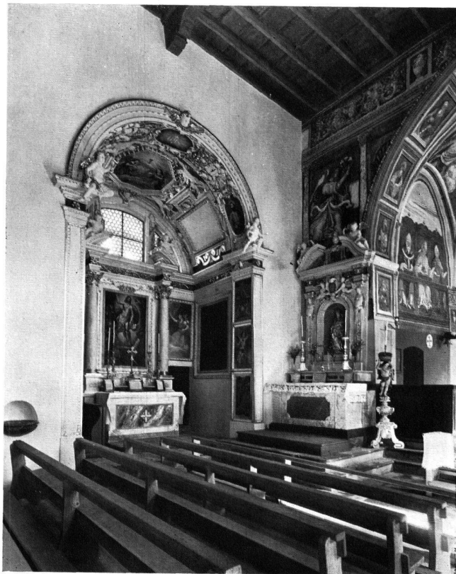
Blick in den Chor und die nördliche Seitenkapelle

ROVEREDO, PFARRKIRCHE S. GIULIO (vgl. Nachrichten S. 145) Nach den Renovationsarbeiten 1945