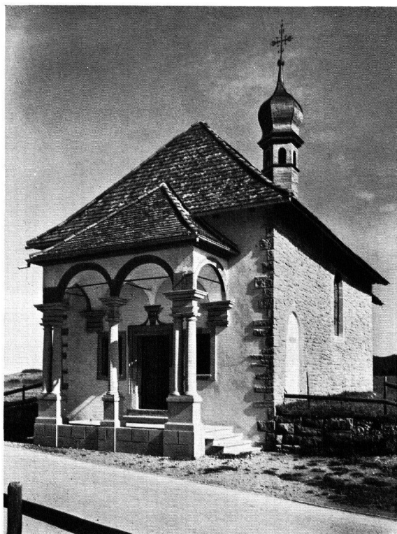
Abb. 4. Einsiedeln, Kapelle St. Gangulph nach der Renovation – Nachrichten S. 64