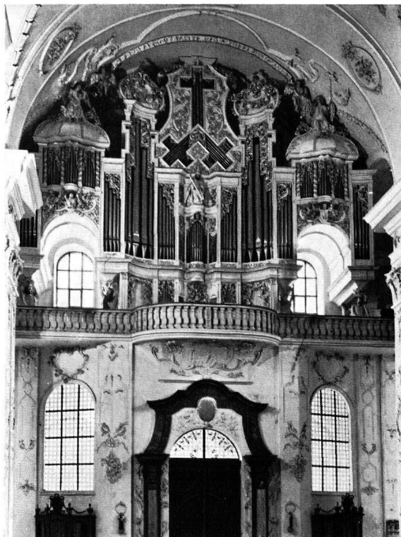
Abb. 3. St. Urban, Stiftskirche, Orgel nach der Renovation Nachrichten S. 64