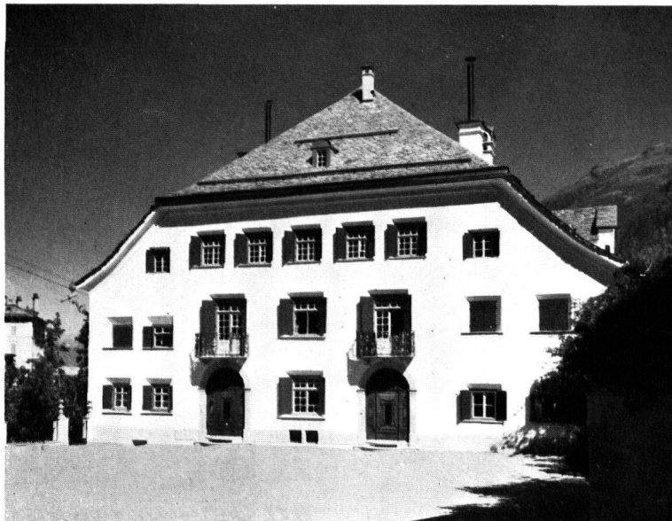
Abb. 2. Samedan, «Plantahaus» Nach der Renovation 1945 – Nachrichten S. 63