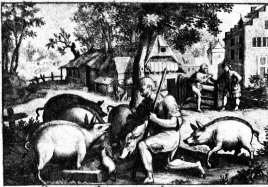
Pauvre et vil, il se ventrait vult pascer porcos. Il quide les pouceins pour viure de leur ralle.