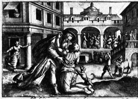
Fils huet genitor conuina leta rruerso. Son pere a son retour habille et luy fait feste.