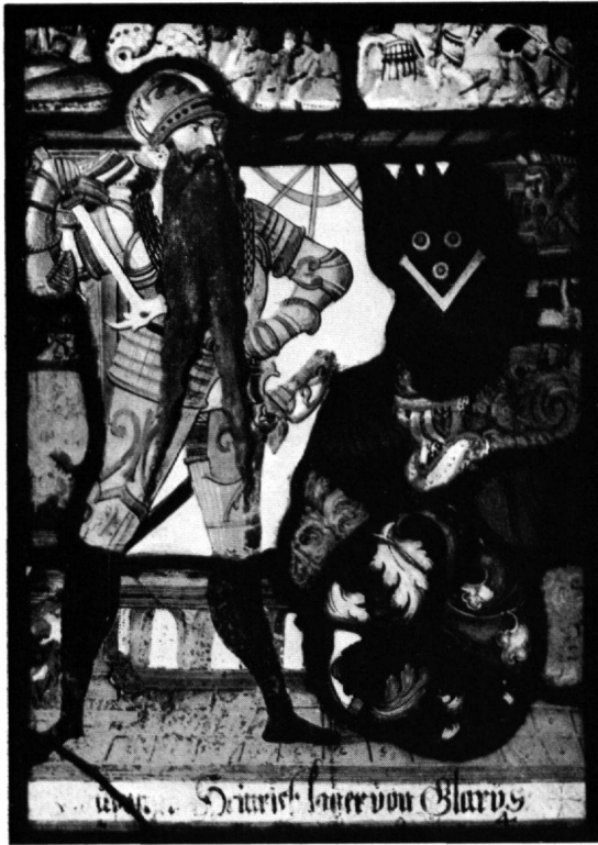
3 Scheibe Hptm. Heinrich Lager, Glarus, 1594