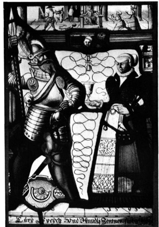
6 Scheibe Speich-Zentner, Glarus, 1595