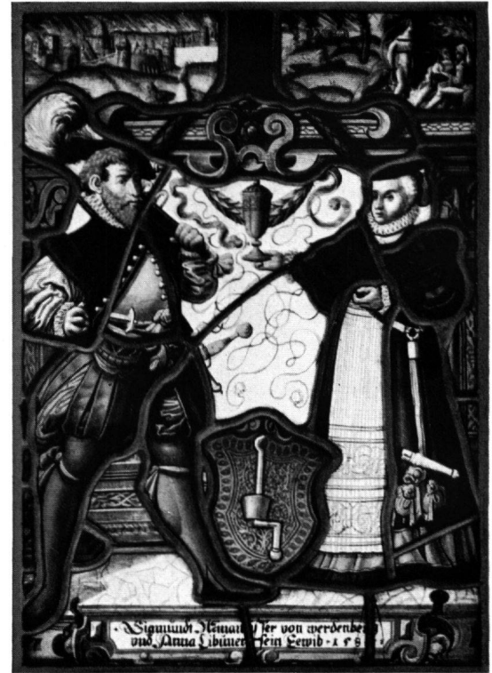
4 Scheibe Winawieser-Lipuner, Werdenberg, 1585