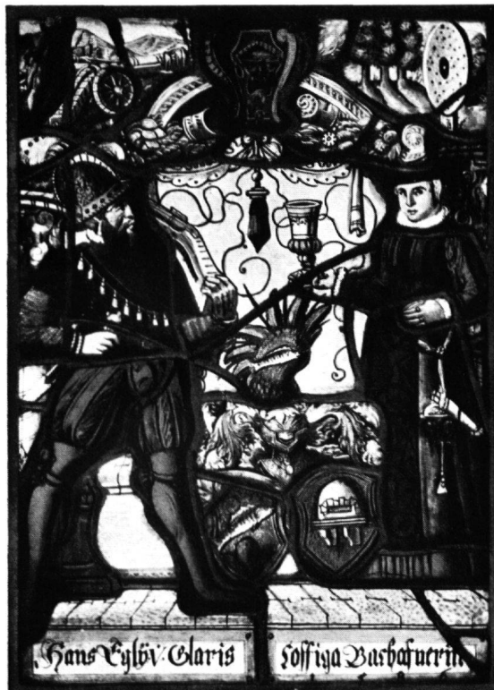
5 Scheibe Egli-Bachofner, Glarus, 1586