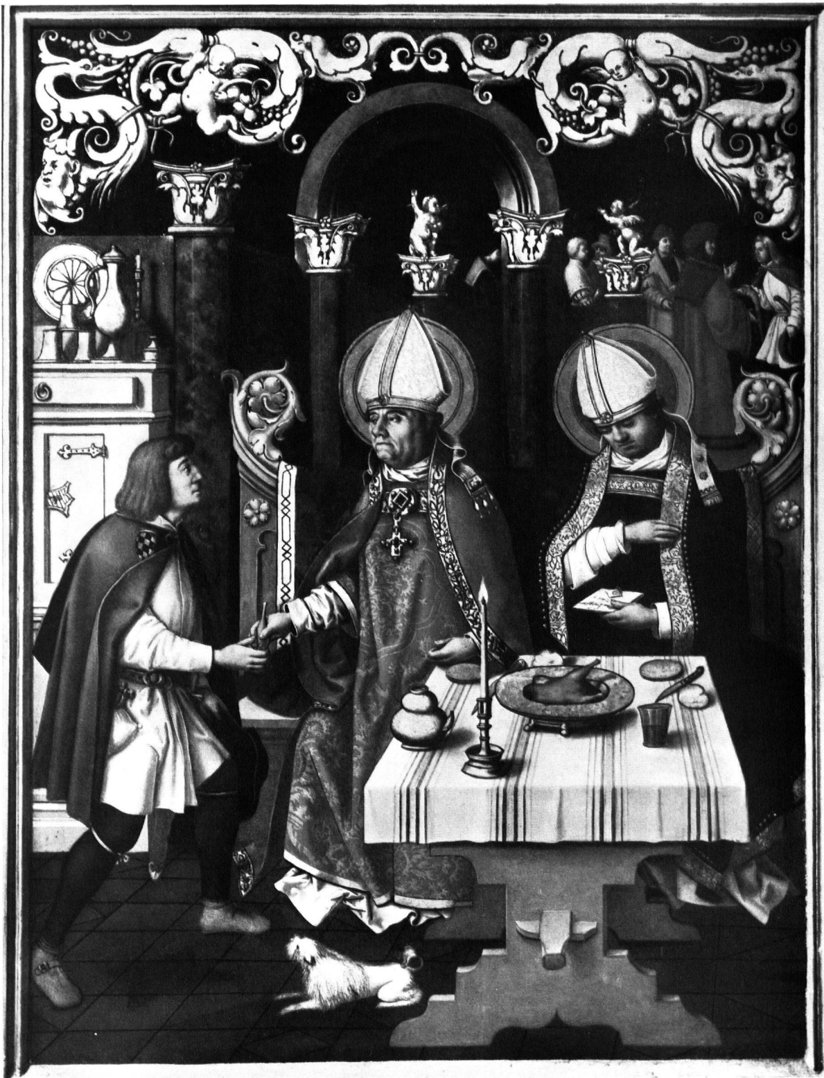
Hans Holbein der Ältere, Das Fischwunder der hl. Bischöfe Ulrich und Wolfgang. Flügel eines Altarwerkes aus dem Katharinenkloster in Augsburg. H. 105 cm, Br. 78 cm. Augsburg, Staatliche Gemäldegalerie