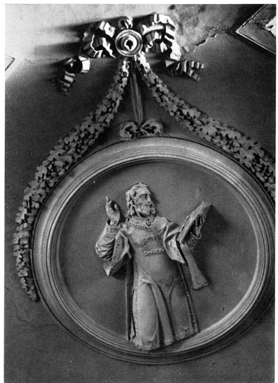
1 Rab (Arbe), Interno del Duomo; Soffitto con stucchi dei Somazzi. - 2-4 Clemente e Giacomo Somazzi, stucchi del 1799 nel Duomo di Rab: 2 S. Cristoforo. - 3 S. Leone. - 4 S. Marino.