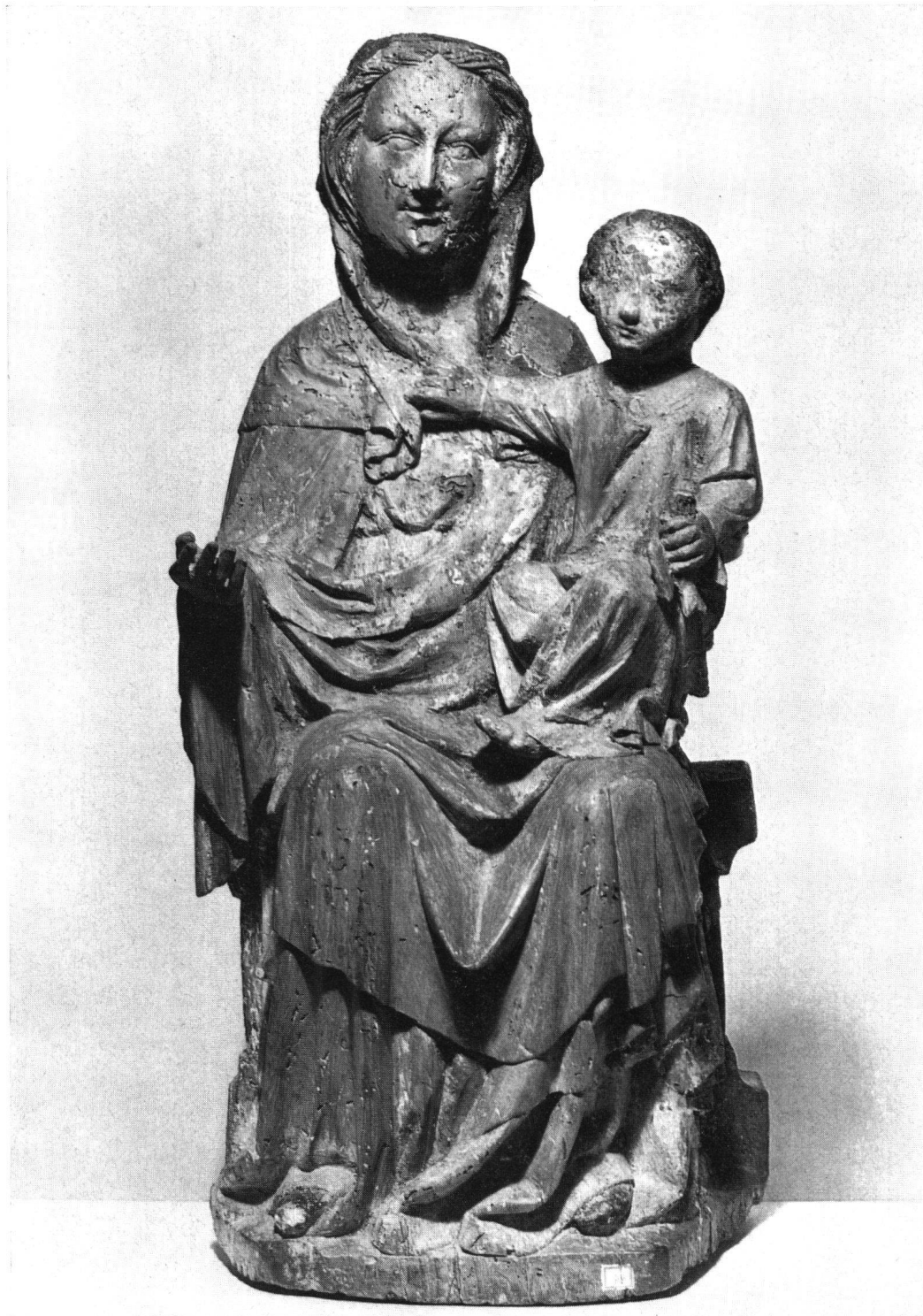
Vierge à l'Enfant, premier tiers du XVI e siècle. Bois de tilleul avec traces de polychromie. Hauteur 76 cm. Acquisée chez un collectionneur de St-Ursanne qui l'avait découverte à Courgenay