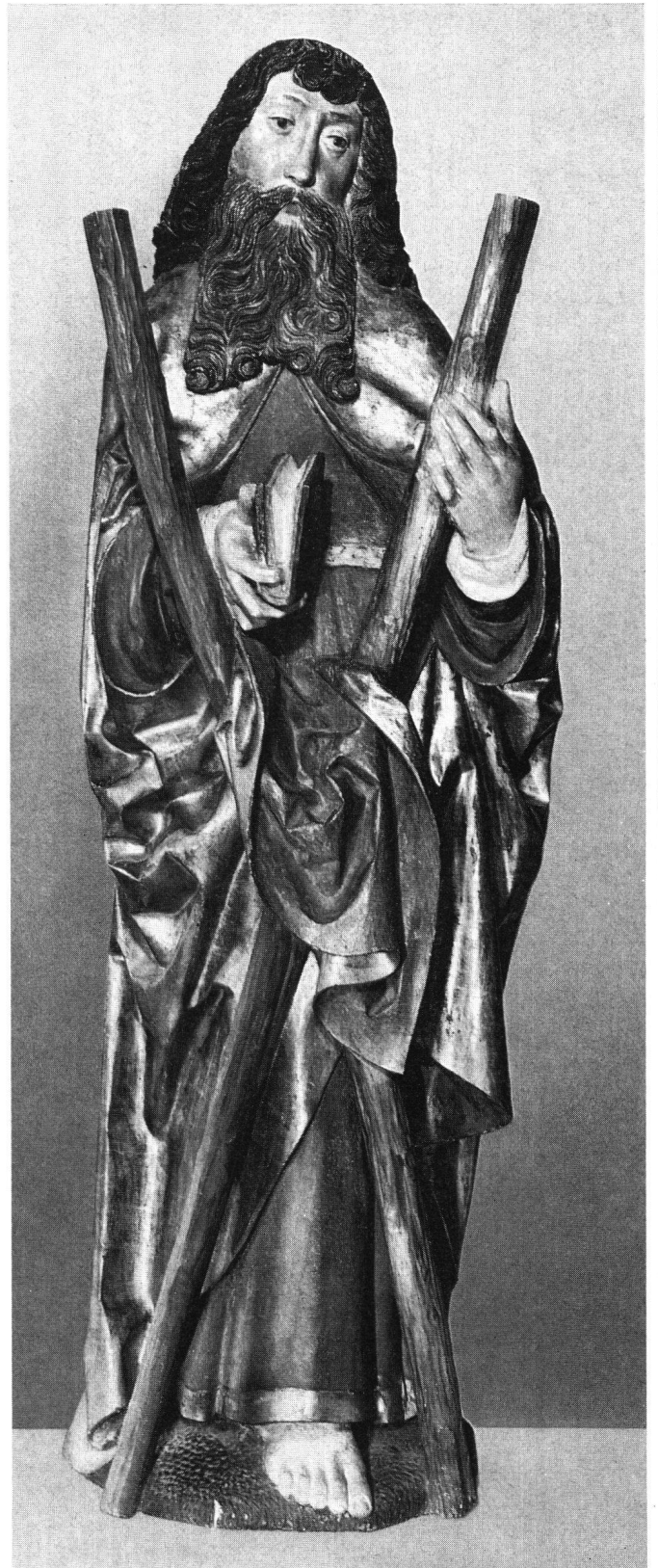
Saint Laurent et saint André. Bois de tilleul évidé, avec polychromie ancienne. Hauteur 174 et 175 cm. Proviennent de l'ancien retable, détruit, du maître-autel de l'église paroissiale de Delémont, exécuté de 1508 à 1510 par MARTIN LEBZELTER de Bâle