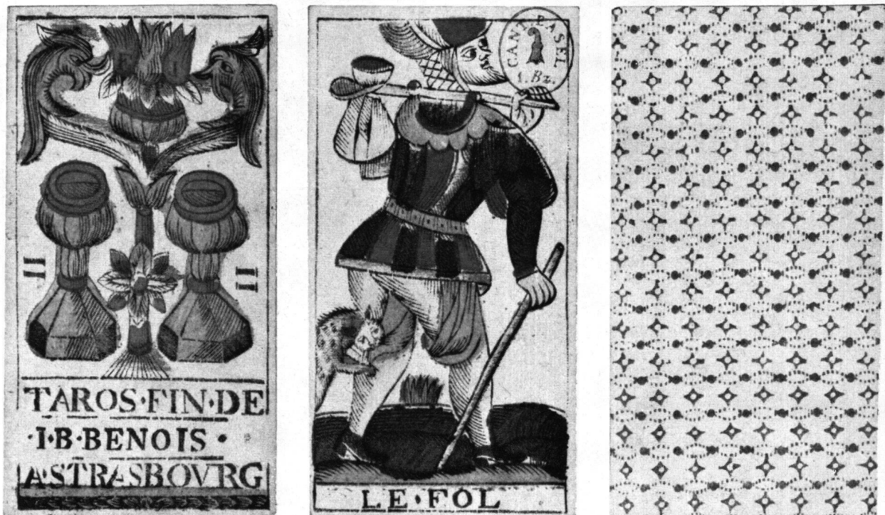
Abb. 2 Tarockkarten mit dem ersten Basler Steuerstempel

Karten und Taroken bestraft werden.» Nach Art.124 gingen die Bußen zu je einem Drittel an den Anzeiger, die Municipalität der Übertretung und die Armenkasse der betreffenden Gemeinde 8 .